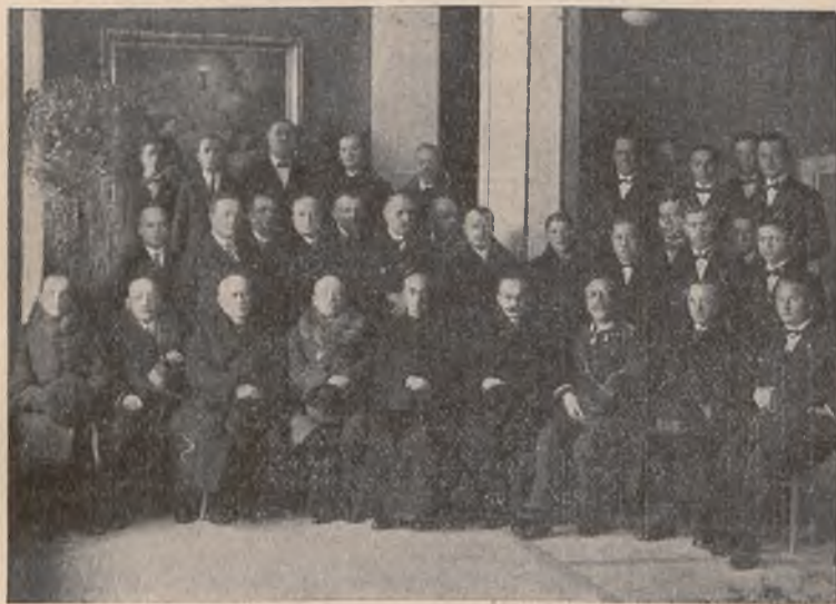
Wybitni przedstawiciele obywatelstwa krakowskiego jako Rada Naczelna Związku, kierują pracami, dbają o rozwój Związku, zarządzają majątkiem i troszczą się o fundusze.

„ Dlaczego nie jesteście jeszcze z nami! “ oto skarga i wyrzut tych setek i tysięcy młodzieży oczekującej od was pomocy choćby drobną ofiarą byle wspólnie a uchronimy od zagłady to dzieło miłości społecznej. „ Przyjdź — zobacz — poznaj a pokochasz nas i będziesz nam przyjacielem...“ Dajemy nasz zapal do życia i pracy — dajemy serca nasze i nieskończoną wdzięczność!