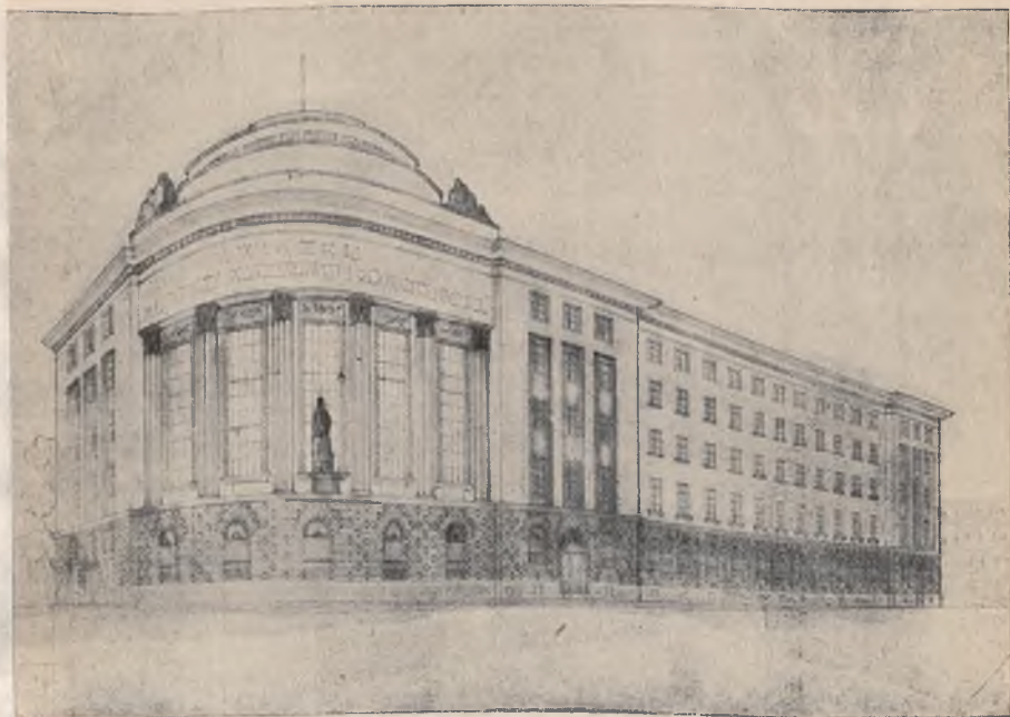
Dom Związku Młodzieży Przemysłowej i Rękodzielniczej w Krakowie.