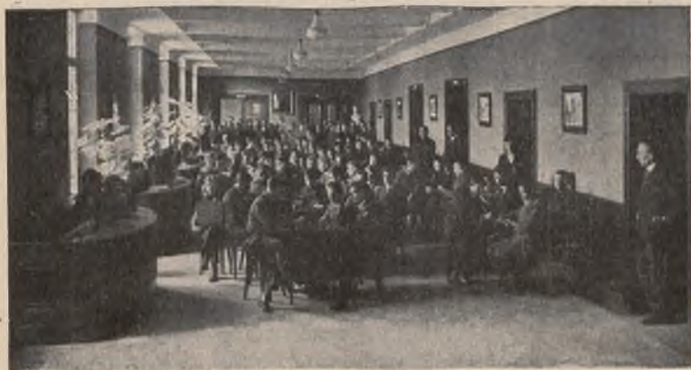
Młodzież korzystająca z urzędzeń domu, podczas niedzielnego zebrania przy grach i zabawach.

Pieniądzy potrzeba jeno, bo utrzymanie setek najbiedniejszej młodzieży (dziś przeszło 300 korzysta z Bursy) stale ich wymaga. Wspólny, wielki wysiłek, praca, miłość i ofiarność zbudowały już wiele!