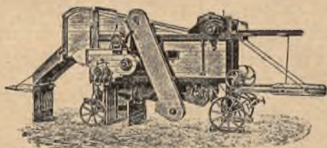
mlátičky „Bratří Jozové“