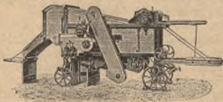
mlátičky „Bratří Jozzové“