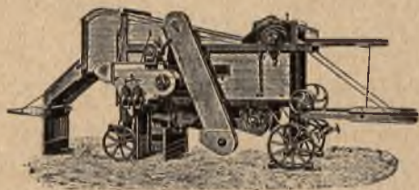
mlátičky „Bratři Jozové“