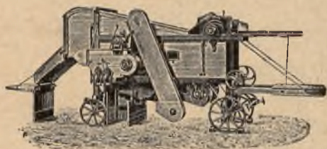
mlátičky „Bratři Jozové“