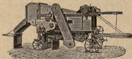
mlátičky „Bratři Jozové“