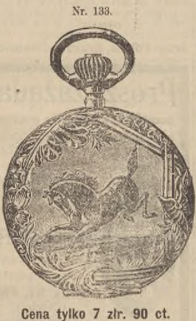
Nr. 133. Cena tylko 7 zlr. 90 ct.

Ceny kart okrętowych: Do KANADY do Quebec (w Quebec) zlr. 60- " Winnipeg (w Manitobie) . . . 88- " Edmonton (w Albercie) . . . 125- " Grelay (w Albercie) . . . 94- itp. Do Stanów Zjednoczonych do Nowego Yorku (New York) zlr. 72- " Chicago (w Illinois) . . . 94- Odjazd z Rotterdamu w każdą sobotę. - We wszelkich kwestiach prosimy zwracać się pod naszym adresem: The Beaver Line Rotterdam 128. Wijnstraat. 125