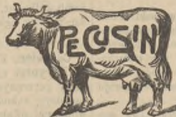
dla wołów i koni etc.

Wskazówki co do sposobu użycia darmo i opłatnie. Paczka 1/2 kg. 1 K. 4 paczki drobne opłatnie 4 K. 1 woreczek próbny 30 hal. Fabryka: Wien IX/2, Bleichergasse 6.