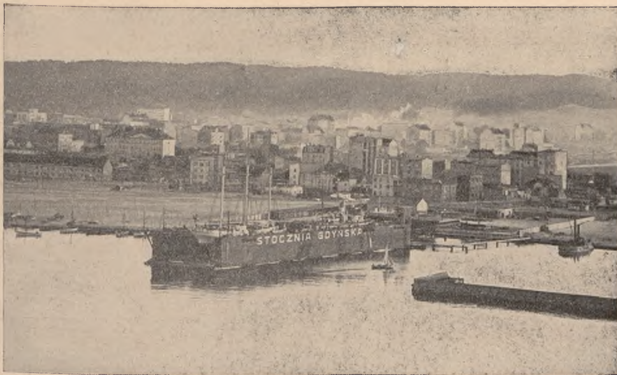
Widok na Gdynię z nab. Śląskiego.

G D Y Ń I A