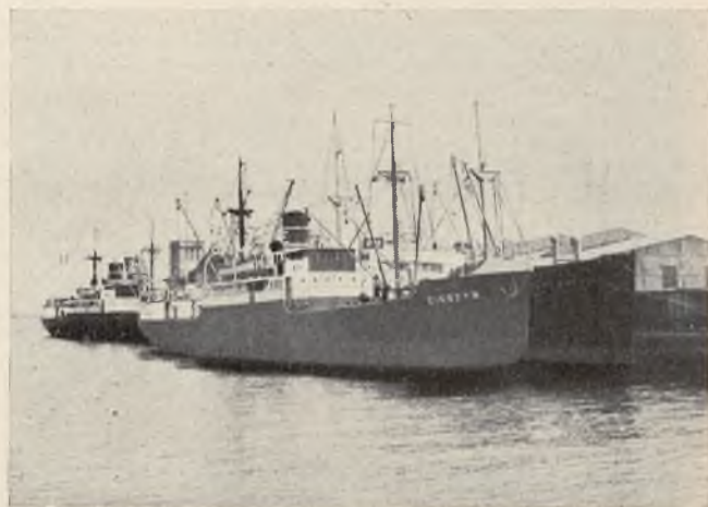
Praca statków przed magazynem Sp. Akc. „Żegluga Polska”.