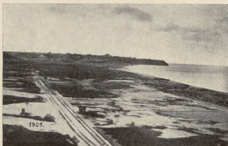
Gdynia w roku 1925.