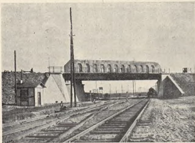
Wiadukt nr. 1.

Dla połączenia miasta Gdyni z przedmieściem Oksywie, Urząd Morski buduje drogę, która biegnie od dworca kolejowego wzdłuż portu, w kierunku prostym na Oksy-