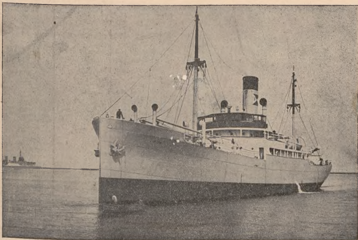
S/S. „Lwów” — 32-gi statek polskiej floty handlowej, wybud. dla Polsko-Bryt. Towarzystwa Okrętowego

POLSKA AGENCJA TELEGRAFICZNA (P. A. T.) G D Y Ń I A