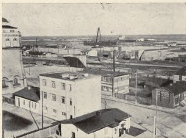
Przyczółki wiaduktu nr. 4.

U W A G I: a) średni tonaż statku, zawijającego do portu w Gdyni w czerwcu: 7576 nrt; b) średnia ilość statków, przebywająca jednocześnie w porcie: 50; c) średni postój statku: 65,5 godzin;