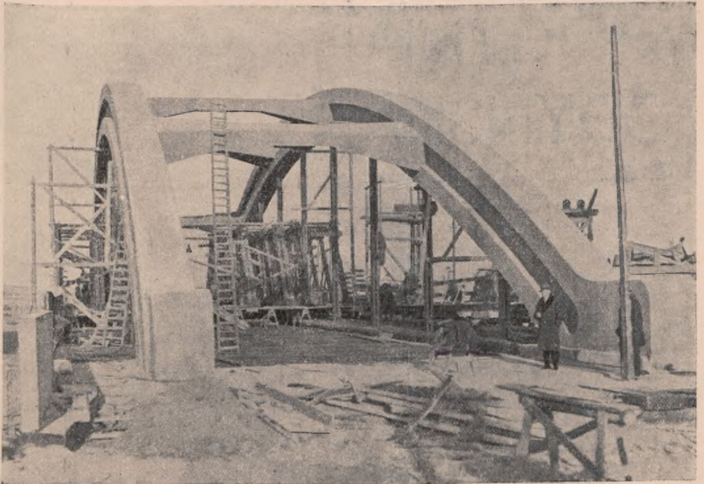
Port w Gdyni. Nowy wiadukt żelazo - betonowy nad torami kolejowymi na molo Węglowem

POLSKA AGENCJA TELEGRAFICZNA (P. A. T.) G D Y Ń I A