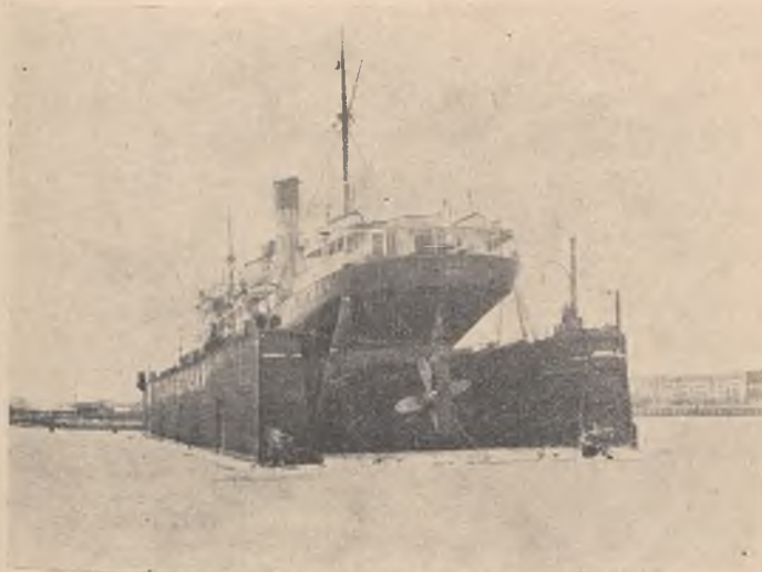
„Łódź” w doku Stoczni Gdyńskiej

W dniach od 17. I. do 25. I. został podniesiony na doku Stoczni Gdyńskiej O. R. P. „Sławomir Czerwiński” (dawn. S/S „Łódź”, Polsko-Brytyjsk. Tow. Okręt), celem zdjęcia pomiarów dla wykonania wykresów teoretycznych oraz zbadania kadłuba.