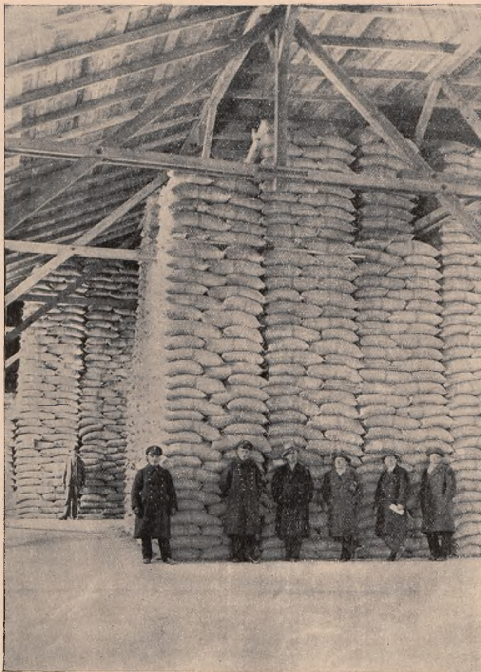
Kawa brazylijska w magazynie portu gdyńskiego.