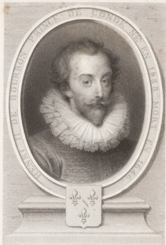
Gravé par Heischmann, sous la direction de Henriquel Dupont, d'après le dessin original fait par Olivier Serret, en 1623, pendant le séjour du Prince à Rome.