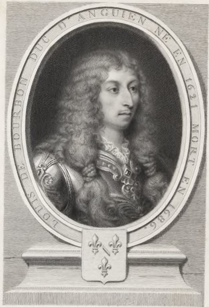
Gravé par A. François, sous la direction de Henriquet Dupont. D'après un portrait peint par Stella.