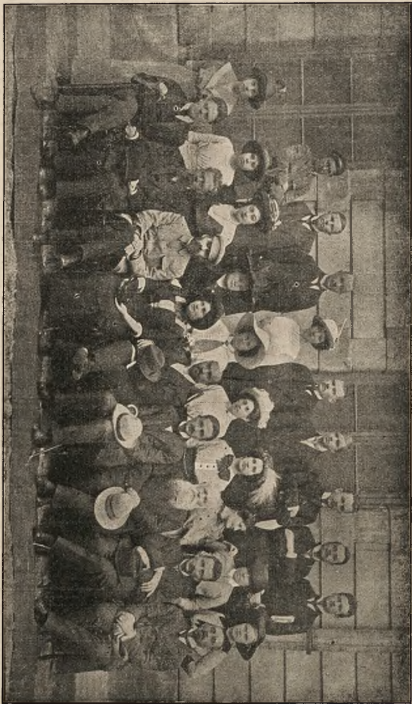
Ś. p. Marszałek Józef Piłsudski (w mundurze strzeleckim) jako prelegent na kursie lwowskiego Ogniska w r. 1913