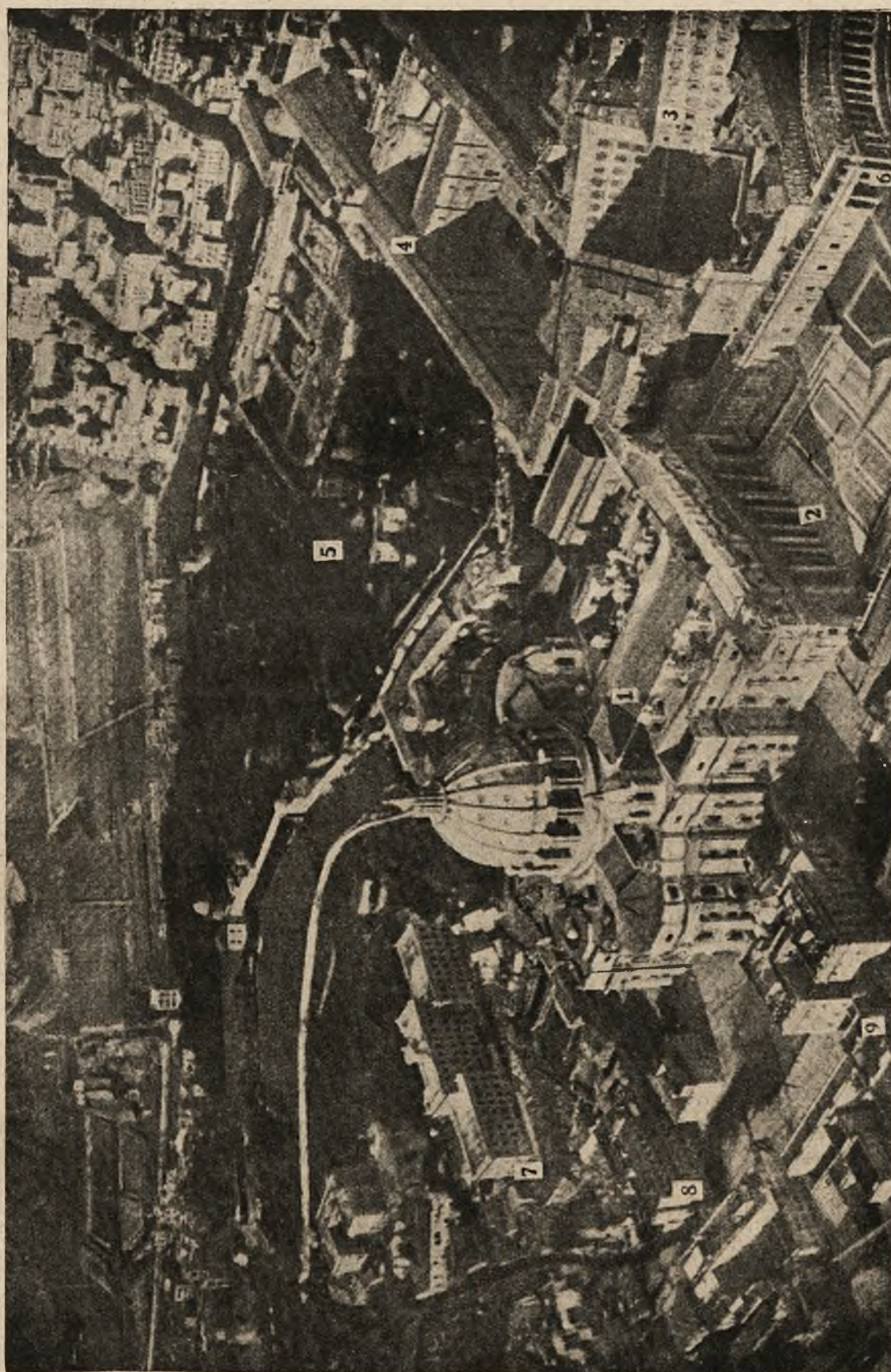
Państwo watykańskie widziane z góry. 1) Kościół św. Piotra. 2) Wejście do kościoła św. Piotra. 3) Mieszkanie Ojca św. 4) Muzea watykańskie. 5) Ogrody papieskie. 6) Wejście do Watykanu. 7) Seminarjum afrykańskie. 8) Seminarjum papieskie. 9) Skarbiec.