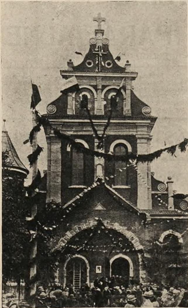
Front nowego kościoła na Zamarstynowie ozdobiony na uroczystość konsekracji.