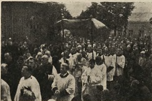
X. Arcybiskup przenosi Przenajśw. Sakrament ze starego kościoła do nowego kościoła.

wiedzy medycznej i z wielkiem uznaniem wspominał o dziele Pasteura, o zwalczaniu śpiączki i tak licznych chorób dziecięcych oraz o postępach, poczynionych w ostatnich czasach w walce z rakiem i cierpieniami płucnymi. Po przemó-