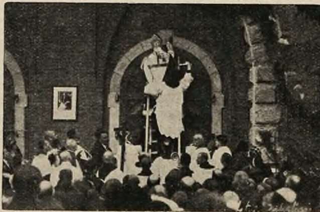
X. Arcybiskup znaczy krzyż krzyżmem św. na obramieniu kamiennem.