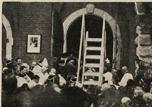
Wnoszenie relikwii do kościoła.