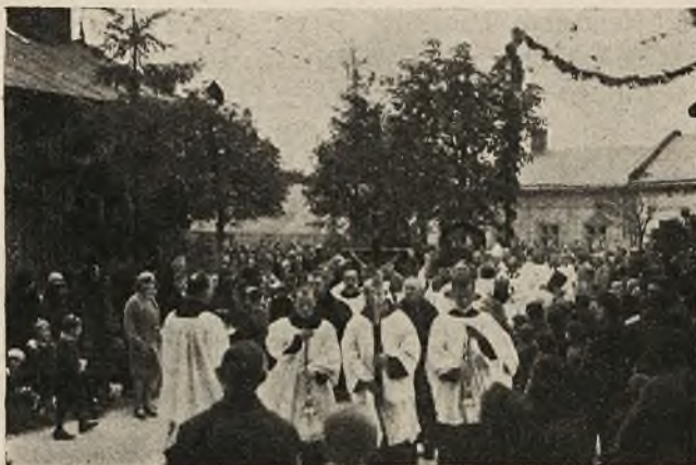
Czoło procesji z relikwiami.

KURSY DLA NAUCZYCIELI RELIGJI W SZKOŁACH ŚREDNICH WE WŁOSZACH. Na kursach dla nauczycieli religji w szkołach średnich, które zorganizował uniwersytet katolicki w Medjolanie, studjuje 841 osób, w tem 688 księży, 64 zakonnice i 79 osób świeckich. Księży 52 należą do zakonów, wśród osób świeckich jest 58 kobiet i 21 mężczyzn.