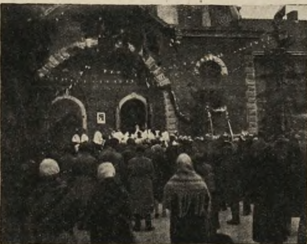
Wejście procesji do kościoła.