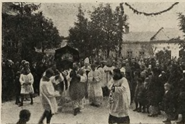
Procesja z relikwiami.