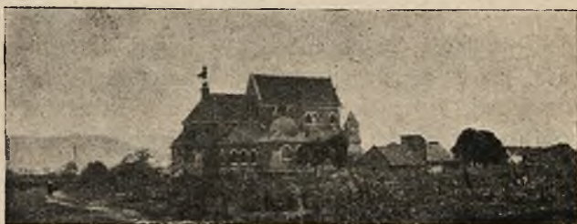
Ogólny widok na kościół i okolicę.