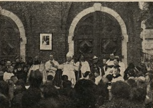
Kazanie X. Arcybiskupa.

wieniu Ojciec św. udzielił lekarzom błogosławieństwa apostołskiego.