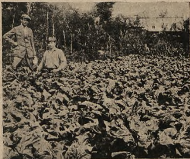
Instruktor roln. zadowolony z lustracji konkursu uprawy buraków.

Stow. Młodzieży Pol. prowadzi ćwiczenia fizyczne w przekonaniu, że wyrabiają one nie tylko mięśnie, ale dodatkowo wpływają i na ducha, wyrabiając wśród młodzieży karność, panowanie nad sobą i wytrwałość.