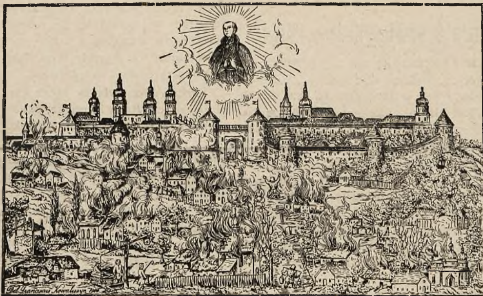
Św. Stanisław ukazuje się w czasie pożaru miasta Lwowa w r. 1623.

Św. Stanisław Kostka, chroniący Lwów przed pożarem czy najazdem turecko-kozackim — to wymowny symbol dla naszych czasów. To drogowskaz — jak mają postępować ci, którym zależy na obronie zagrożonego grodu i dusz jego mieszkańców.