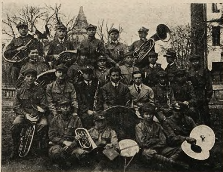
Orkiestra Stowarzyszenia im. św. Stanisława Kostki we Lwowie.

Pragniemy gorąco, aby z okazji obchodu 10-lecia swego istnienia Związek katolickiej młodzieży posiadał swój własny sztandar z wizerunkiem św. Stanisława Kostki.