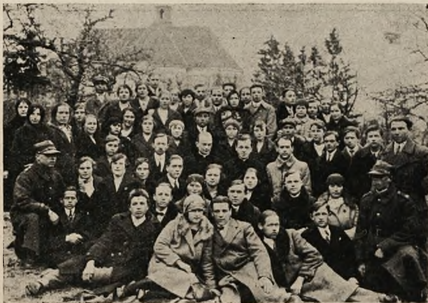
Praca oświatowa w Stowarz. Młodzieży Polskiej.

W łączności ze Zjednoczeniem pozostaje księgarnia i drukarnia „Ostoja“, gdzie wychodzą następujące miesięczniki dla młodzieży: „Młoda Polska“ (dla dziewcząt), „Przyjacieli