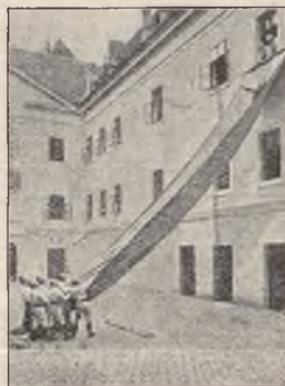
Originalne worki ratunkowe.

dostarcza wszelkie przybory dla pożarnictwa w najlepszym gatunku i po niskich cenach.