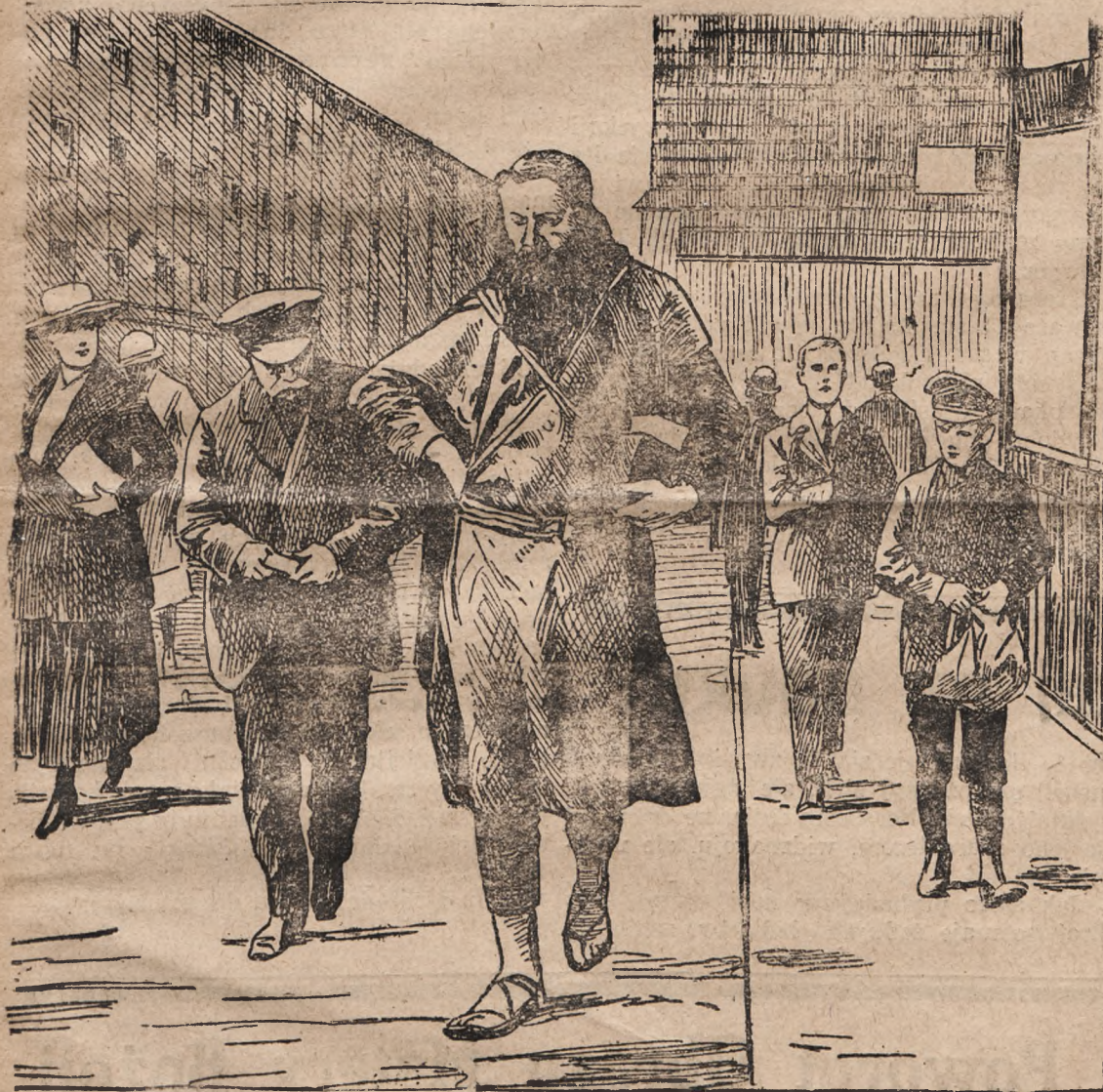
Objasnenie na 4 storoni.