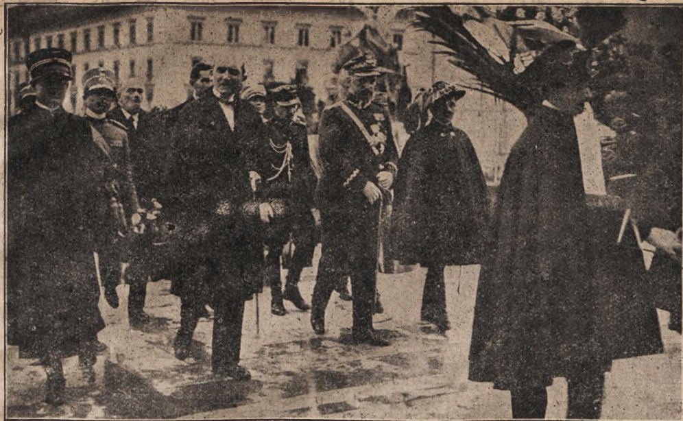
W Warszawie widbuły sia w serpny welyki torżestwa w ricznyciu widnesenoji 15 VIII. 1920 r. pobidy nad bolszewikamy pid Warszawoju. Na ilustraciji powyższiej baczmy torżestwennyj pochid z Zamku Koroliwskoho w Warszawie, w kotrin berut uczať takož predstawnyky inszych derżaw.