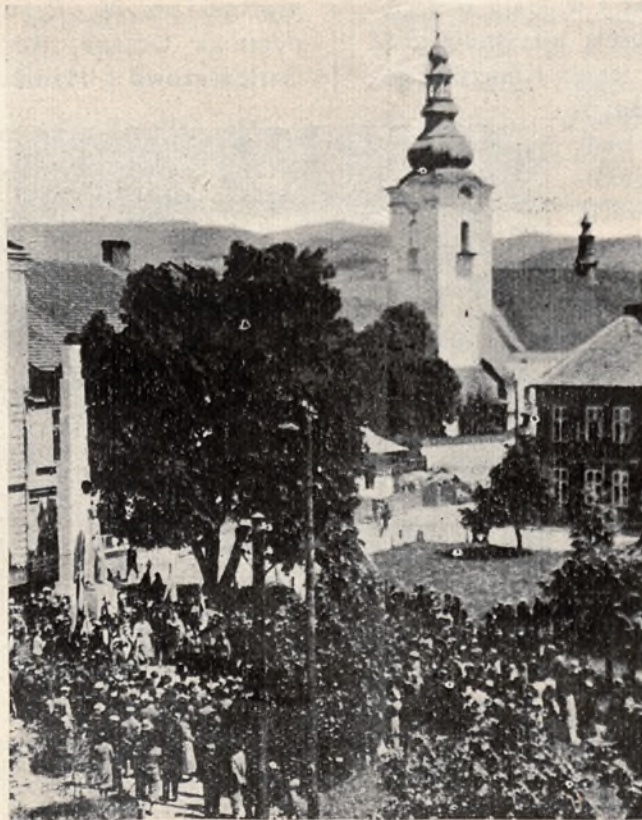
Widok na Plac Słowackiego i kościół paraf. w Nowym Targu. Pod pomnikiem Wł. Orkana ludność zgromadzona z okazji złożenia wieńca przez delegację Zw. Podhalan w Ameryce Pół.

Z szerokich pól Minnesoty, z dalekich lasów Wiskonsynu, z głębokich kopalń Pensylwanii, z nad burzliwych wód Pięciu Wielkich Jezior Ameryki Północnej, przywożę Wam bracia Podhalanie góralskie pozdrowienia. Wszędzie w Ameryce, gdziekolwiek się człek obróci, spotka się z naszym rodowitym górąlem, a poznać go po mowie, bo choć po angielsku będzie pretasił, wymowę ma naszą góralską. Nie wiadano dawniej, gdzie są ci Podhalanie, ilu ich jest, czym się zajmują i gdzie największe ich skupienia. Dopiero Związek Podhalan w Północnej Ameryce z siedzibą w Chicago zainteresował się nimi, skupił ich pod swoje skrzydła i zorganizował pod swoim znakiem: kozicy na tle spinki góralskiej. Ciężkie czasy przeżywał Związek Podhalan w Ameryce z powodu