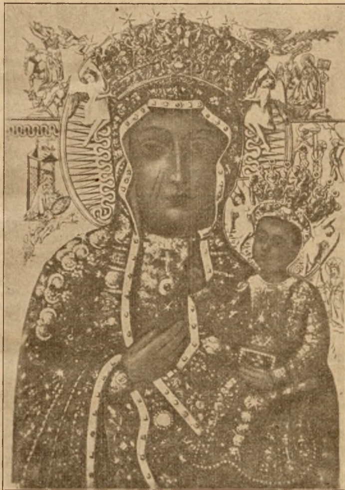
Cudowy obraz M. B. Częstochowskiej.

w okresie, kiedy kraj nasz szuka nowych form rozwiązania wielu problemów społecznych, któreby nam zapewniły możliwość uniknięcia niepożądanych wstrząsów, jakie w dobie obecnej niektóre narody przeżywają.