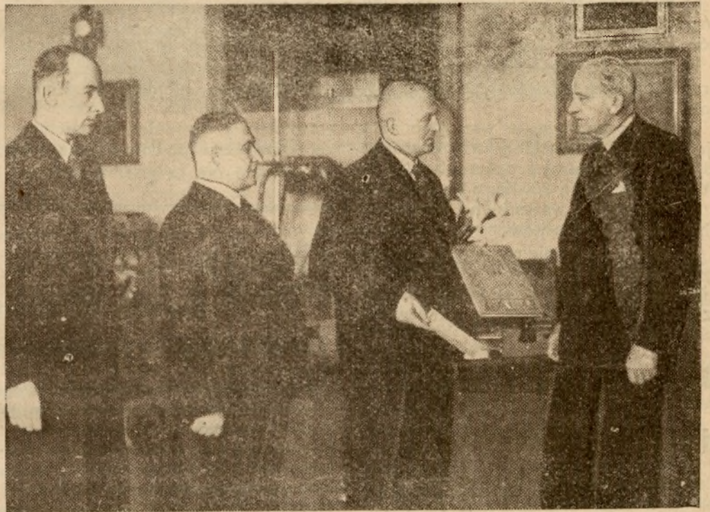
Pracownicy przemysłowi i handlowi ze Śląska na audiencji u Pana Prezydenta

W tych warunkach rzemieślnik czy drobny kupiec polski nie może marzyć nawet o konkurowaniu z rzemieślnikiem, czy kupcem żydowskim, posiadającym do dyspozycji tak zmontowany aparat CKB i korzystającym z bezprocentowych kredytów nie tylko gotówkowych lecz i towarowych, co pozwala mu dowolnie obniżać cenę dla niszczenia polskiego konkurenta. Jest to tembardziej możliwe,