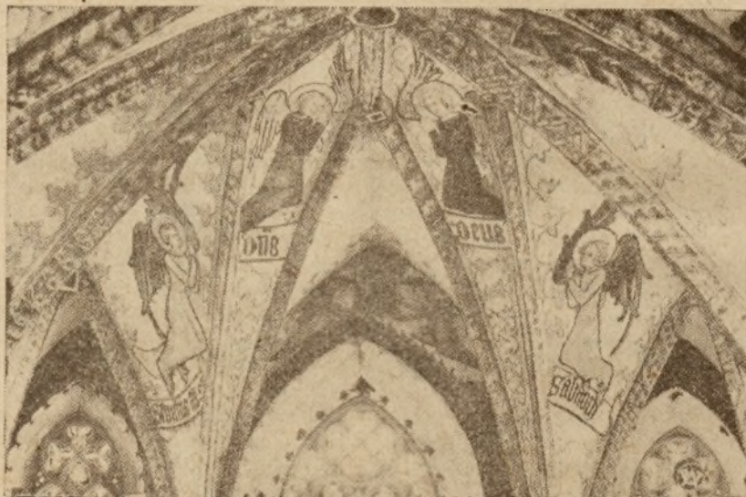
Fragment sklepienia w prezbiterium z cennymi malowidłami XIV-go wieku w kościele św. Jakóba w starożytnym Toruniu.

Gdyby z ważnych powodów „dzień urzędowania Izby” nie mógł odbyć się w poniedziałek, przesunięty zostanie na inny dzień, o czym Izba zawiadomi zainteresowanych.