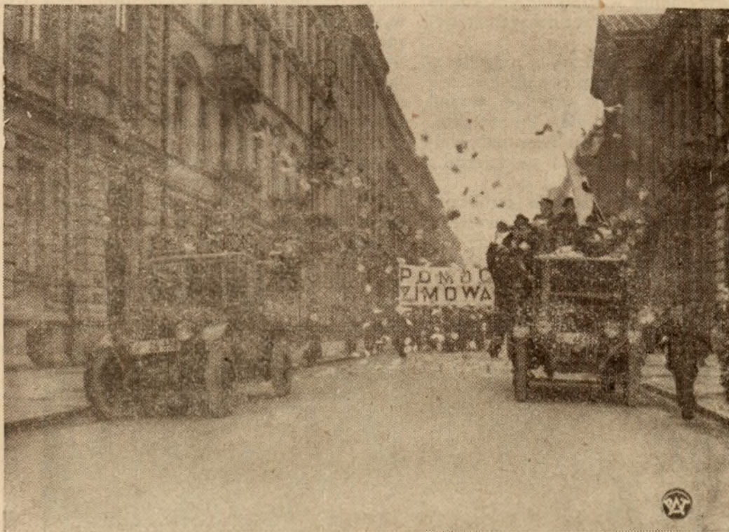
Fragment akcji propagandowej, na rzecz Pomocy Zimowej Bezrobotnym, przeprowadzonej przez młodzież harcerską w Warszawie na ciężarowych samochodach.

wszystkim obsłużyć swoją klientelę. Niechaj ten patriotyczny czyn Polek z za oceanu, będzie dla was w kraju pięknym przykładem do naśladowania, by można było kiedyś o was powiedzieć, że przyczyniłyście się do wywalczenia, Polsce tak bardzo potrzebnej niezależności gospodarczej.