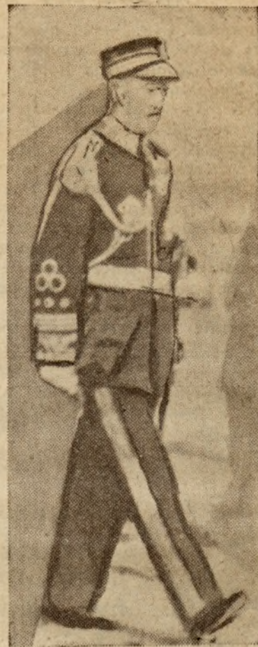
Uwięziony Marszałek chiński Czang-Kai-Szek.

Oto kilka najczęściej powtarzających się napisów: „ Ambicja moja jest jedna—uczynić Naród Włoski sławnym i wielkim ”, „ Naród Włoski mieć będzie pierwsze miejsce na świecie ”, „ Kto nie jest gotów umrzeć za Ojczyznę, ten nie jest godnym żyć wśród współobywateli ”. A skoro takimi hasłami od lat kilkunastu karmi się Włochów, skoro co ważniejsza, ich treścią wypełnione jest bez reszty życie publiczne Włoch, — nie trudno wytłumaczyć, skąd bierze się z jednej strony prawdziwy entuzjazm oraz cześć i przywiązanie dla Mussoliniego, a z drugiej strony ogromne podniesienie się polityczne, moralne i materialne Włoch. Szczególnie nam przybyłym z Polski i przyzwyczajonym niestety do czegoś wręcz przeciwnego, — nie trudno nie tylko na włoskim przykładzie zrozumieć, że jeśli rządzący takim językiem przemawiają do rządzonych, potrafią bez trudu wykrzesać z nich zbiorowy entuzjazm i mocną ambicję narodową, bez których w dzisiejszych czasach nie można niczego wielkiego dokonać.