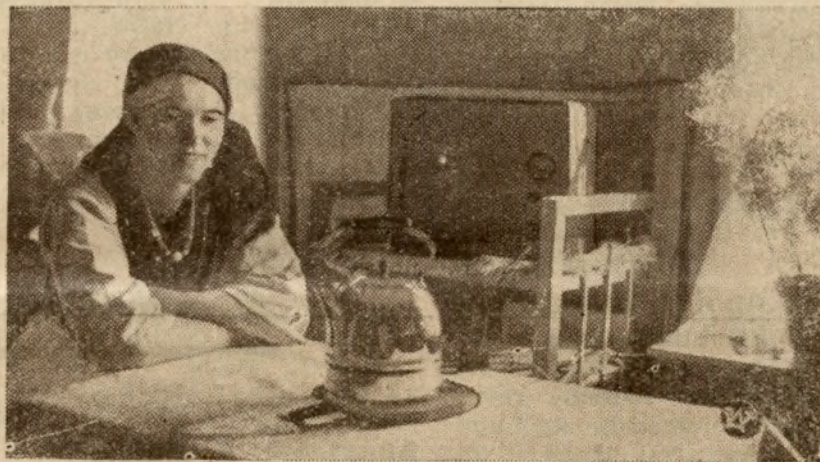
Zdjęcie przedstawia wieśniaczkę przy elektrycznym czajniku, który jest symbolem kultury i postępu w dzisiejszych czasach

ta była bardzo często robiona i zawsze te same wydała rezultaty. Tak od trosk jak i od pracy uciec nie można, bo one są przeznaczeniem ludzkości. Kto dlatego się cęca, żeby uniknąć niepokojów, ten się przekonywa, że niepokoje za nim idą. Leniwemu może się udać mniej światu dać pracy, jak powinien, ale natura to mniej — potrafi dla niego zamienić na wiele i obciążyć jak brzemieniem. Kto siebie tylko chce zadowolnić, wcześniej czy później, a prawdopoaobnie bardzo wcześniej pozna, że ma bardzo surowego pana i tym sposobem słabość cęcająca się przed odpowiedzialnością znajdzie karę w sobie samej — bo gdzie wielkie interesa zostały wypuszczone, tam małe rzeczy zmieniają się w olbrzymie i ten sam duchowy mózół i praca zwrócone do rzeczy istotnej wartości byłyby zdrowymi i użytecznymi, tu trawią się na drobnych i ciasnych fantazjach, spłodzonych przez niezajęty niczem umysł”.