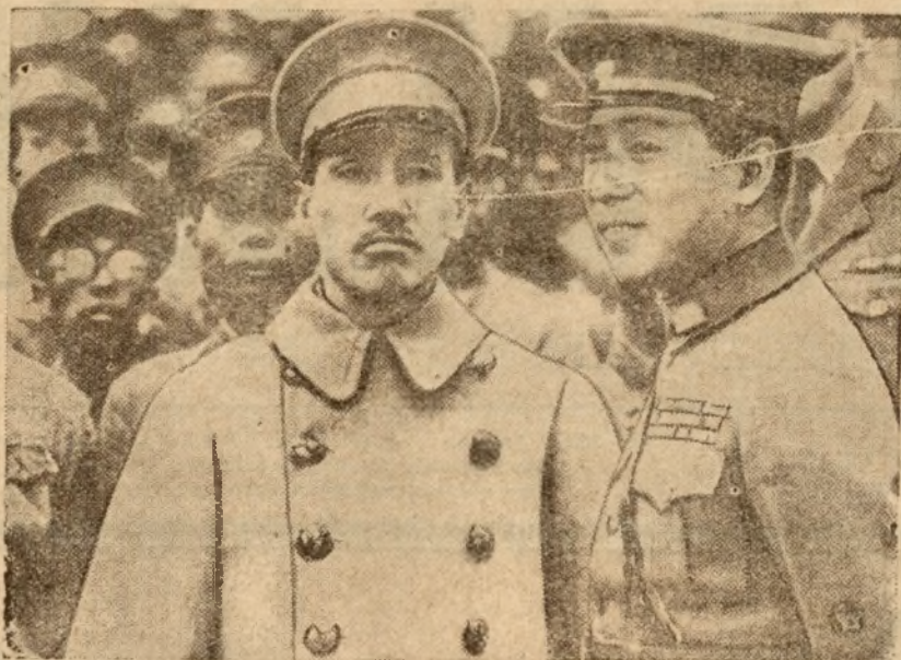
Zdjęcie przedstawia na lewo uwolnionego dyktatora Chin marsz. Czang Kai Sze na prawo przywódcę rewolty wojskowej w Sian-Fu, Czang-Sue-Lianga.