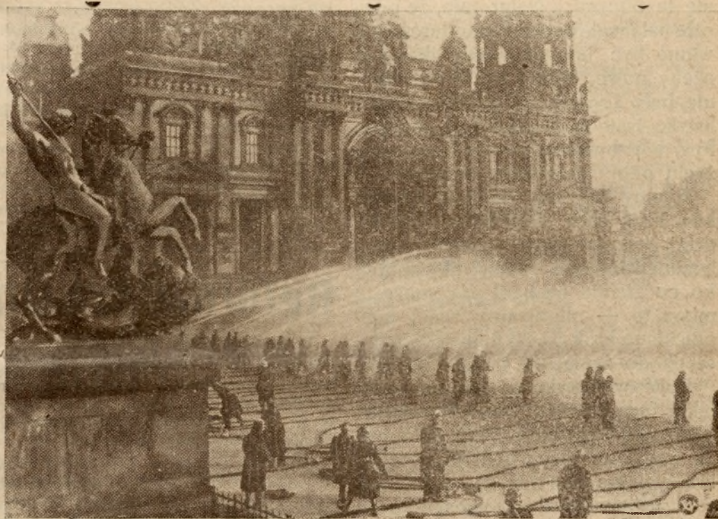
Zdjęcie nasze przedstawia pokaz niemieckiej straży ogniowej, który odbył się w tych dniach w Berlinie.

wysiłki, aby zapewnić nowemu pokoleniu żydowskiemu w Polsce z d r o w e warunki emigracji, w której może liczyć na życzliwą pomoc i opiekę rządu polskiego“.