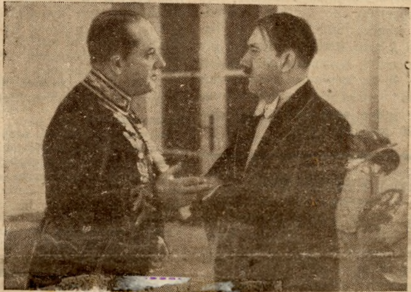
Reprodukujemy zdjęcie, przedstawiające ambasadora R. P. w Berlinie Lipskiego w rozmowie z kanclerzem Hitlerem, podczas przyjęcia.

Znając nieco stosunki amerykańskie, stwierdzić można, że ów oddział nowojorski Syndykatu, to wydawnictwo pewnego dziennika znanego z wybitnie filosemickich poglądów.