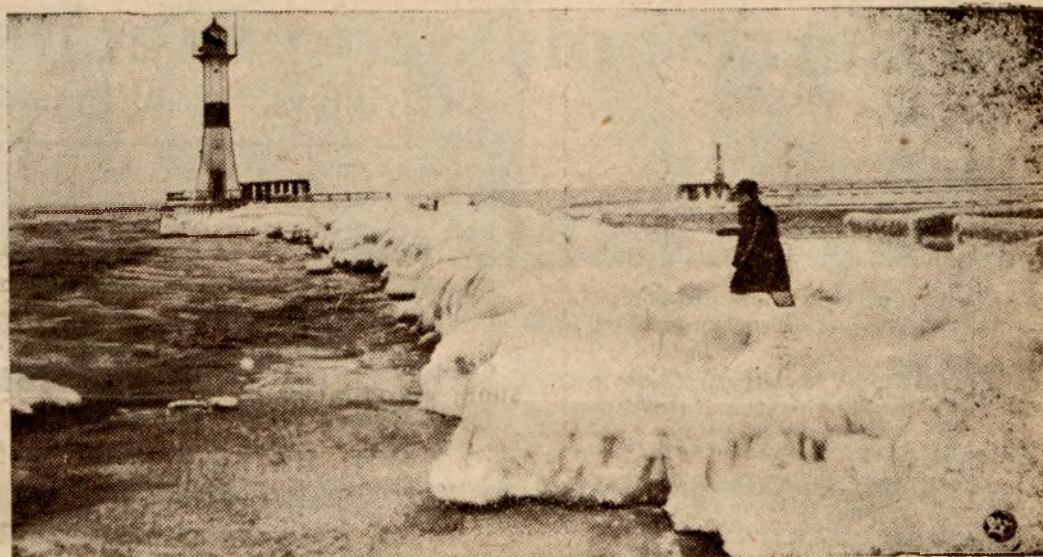
Reprodukujemy malownicze zdjęcie, przedstawiające fragment wybrzeża szwedzkiego w zimowej szacie. Na drugim planie widoczna latarnia morska.

jeden z poważniejszych ośrodków żeglugi śródlądowej, który już obecnie przewozi wielkie ilości transportu towarów, przeznaczonych dla obydwu portów polskiego obszaru rolnego.