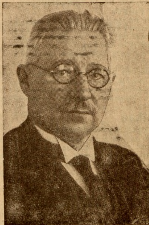
Minister Wyznań Religijnych i Oświecenia Publicznego, prof. Wojciech Świętosławski, przedstawiciel władz państwowych w czasie pielgrzymki nauczycielstwa polskiego na Jasną Górę.