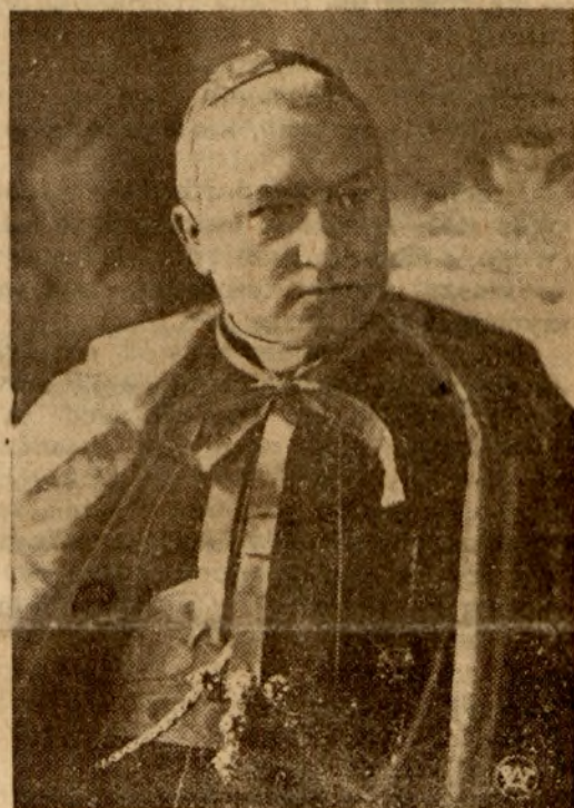
Dostojny Opiekun Pielgrzymki Nauczycielstwa Polskiego na Jasną Górę, Prymas Polski, J. E. Ks. Kardynał August Hlond.

dzieci znaleźli wreszcie właściwą drogę, drogę jedyną, drogę niezawodną do osiągnięcia ideału pełnowartościowego człowieka, dobrego katolika i obywatela Państwa