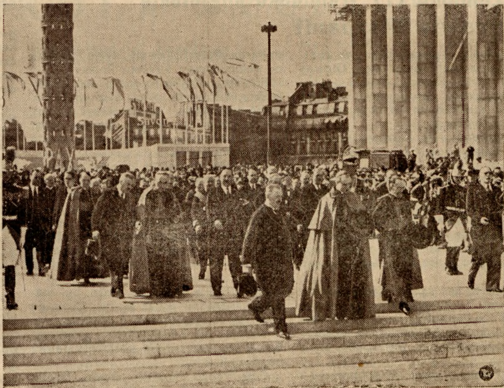
Legat papieski, Jego Eminencja Ks. Kardynał Pacelli udaje się wraz ze świtą do pawilonu watykańskiego na Wystawie Światowej w Paryżu