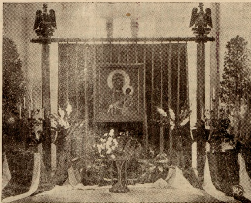
W kaplicy polskiej w bazylice Najświętszego Serca Jezusowego w Liege (Belgia) znajduje się kopia cudownego obrazu Matki Boskiej Częstochowskiej, którą na powyższym zdjęciu przedstawiamy.

nia jaknajwiększych zapasów towaru na najbliższy sezon zimowy.