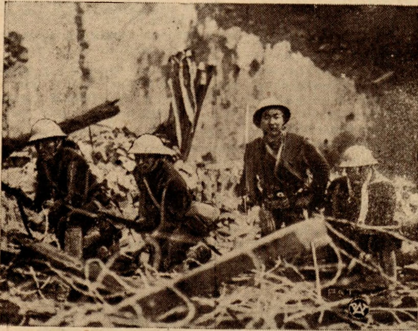
Reprodukujemy zdjęcie przedstawiające patrol żołnierzy japońskich na placówce niedaleko Szanghaju.