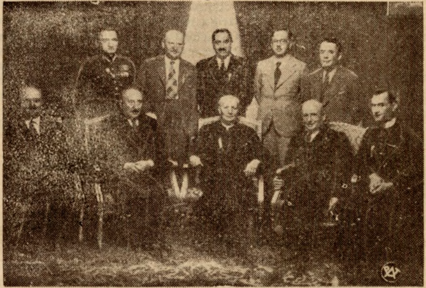
Przed kilku dniami bawili w Krynicy przywódca Słowackiego Stronnictwa ks. Hlinka wraz z posłem do parlamentu praskiego Sidorem, których na zdjęciu (w środku) widzimy.