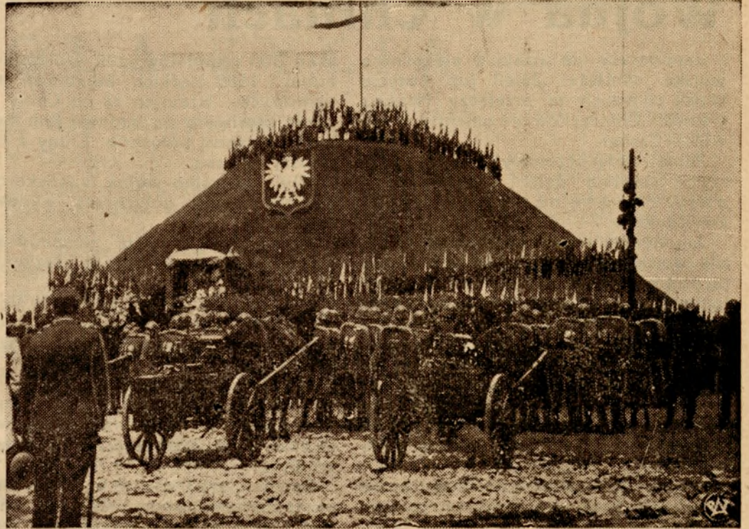
Kopiec Wyzwolenia w Piekarach Śląskich wzniesiony na pamiątkę przyłączenia Górnego Śląska do Polski.

Kierowca, który przez nieuwagę spowodował katastrofę, zdążył wyskoczyć z wozu i uratować swoje życie. Czując swą winę, usiłował zbiec, ale ujęto go we Wrześni i osadzono w więzieniu