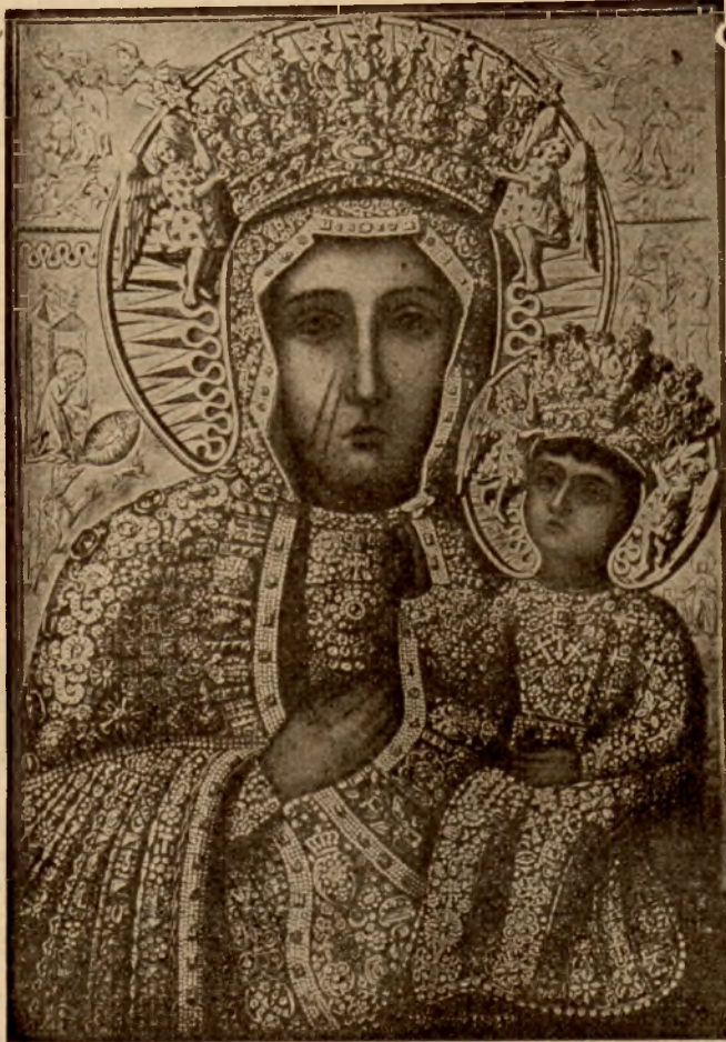
Cudowny obraz Matki Boskiej Częstochowskiej