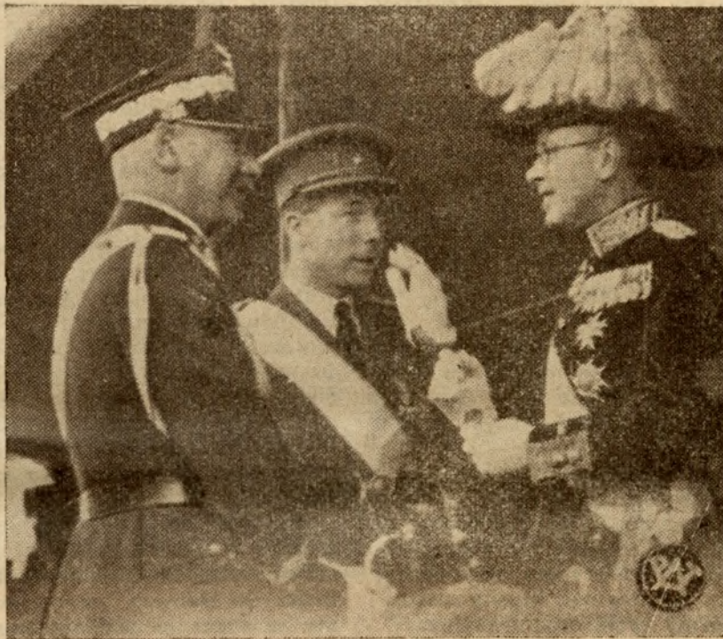
Marszałek Śmigły-Rydz na trybunie honorowej, w rozmowie ze szwedzkim następcą tronu ks. Karolem Adolfem i bratem króla belgijskiego.