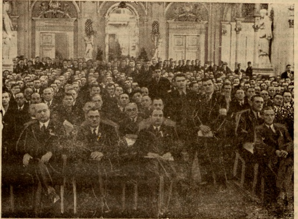
Sala Rady Miejskiej, podczas obrad Kongresu Zjednoczenia Polskich Związków Zawodowych.

Zjednoczenie wiąże mocno robotnika z interesem państwa, a broniąc praw zawodowych robotnika, pragnie odbarwić je całkowicie od pierwiastka politycznego i dąży do zapewnienia robotnikowi należytej mu roli w życiu publicznym nad budowaniem silnej Polski. Wyzwolony z pod wpływów międzynarodówek robotnik polski, tak jak przed wielu laty w okresie kierowania nim przez Józefa Piłsudskiego widzieć będzie znów wszystkie sprawy swoje zawodowe związane nierozzerwalnie i wyłącznie tylko z interesem i potęgą państwa.