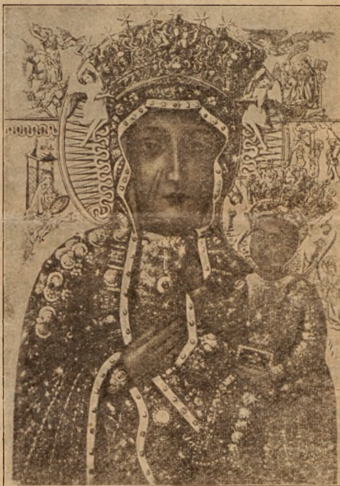
Cudowny obraz Matki Boskiej Częstochowskiej