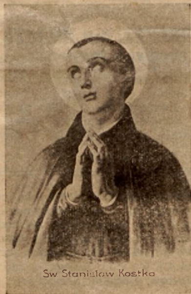
Sw Stanisław Kostka

wom przynoszą tylko duchową i materialną niewolę i nędzę.