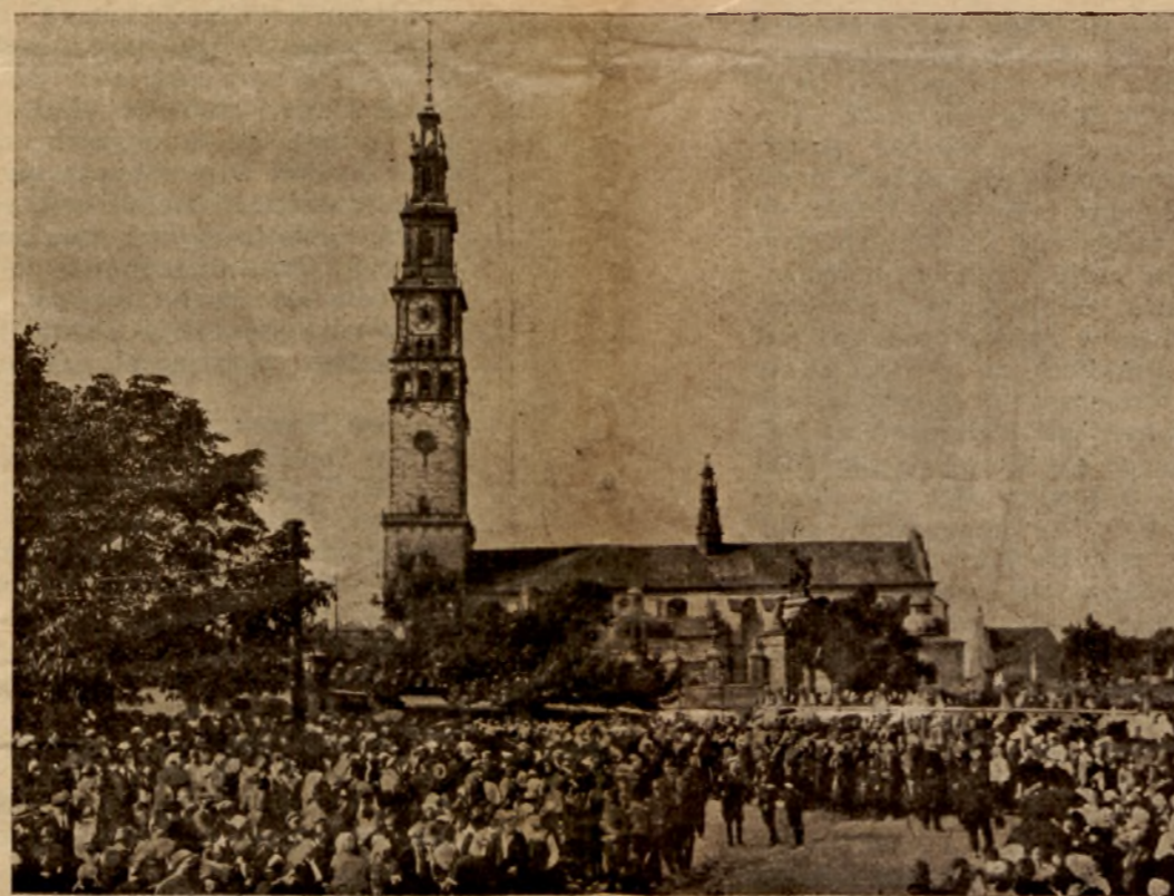
Jasna Góra w czasie odpustu 8 września