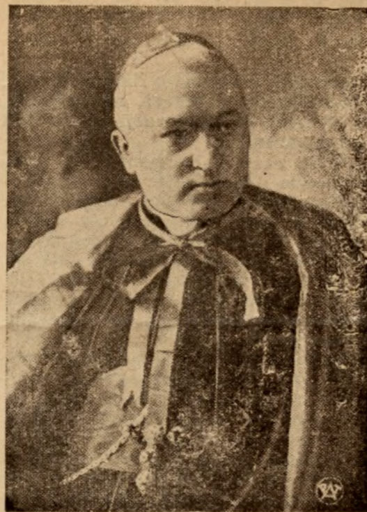
J. E. ks. Kardynał Prymas Polski August Hlond