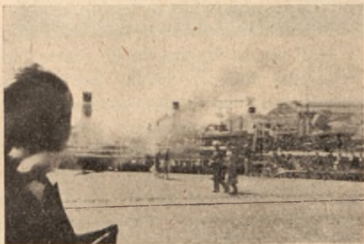
Norwegia — Tröleborg

Całe szczęście, że te przeżycia mocne a najbardziej niesamowite ominęły mnie na pięknym promie Konung Gustaw V na trasie Sasnitz-Tröleborg, choć dla mnie nie miałyby tak smutnych następstw, jak dla zawodników, których wyniki zależały przecie od ilości posiadanych sił żywotnych. A oni pozbywali się ich w sposób zielonkawcy i sprinterski. Zielonkawcy z twarzy, sprinterski ze względu na szybkość, z jaką dobiegali do barjer. Padło nawet podejrzenie, że Konung Gustaw kieruje się do innego portu bałtyckiego, a nie Tröleborgu.