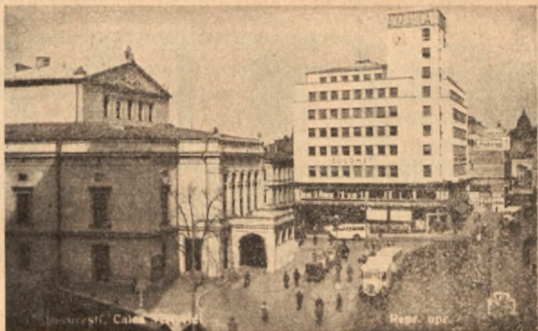
BUKARESZT — Aleja Zwycięstwa

zamglonych latarni. Tylko gdzieś tam gdzieś przemknęło auto lub dorożka z koniem człapiącym jednakowo przy pogodzie i na deszczu do taktu łoskotu kół. Smutny był Kraków, gdy z niego wyjeżdżałem. Ale broń Boże nie z powodu mego wyjazdu. Były już wakacje i Kraków był pozbawiony w większej części swych najweselszych mieszkańców tj. młodzieży. Ostatni Mohikanie są jeszcze na dworcu. Kilka wycieczek harcerzy-ucniów opuszcza jeszcze Kraków. Żegnają go wesoło. Przecież i tak wnet do niego powrócą. W pociągu ścisk niemożliwy. Stoję oparty o drzwi trzymając dzielnie walizę na jednej nodze, podczas gdy na drugiej stoi jakaś pani o tuszy w każdym razie większej niż moja walizka i z wdziękiem wykonuje jakieś taneczne ruchy przy kołysaniu pociągu, właśnie na moich nagniotkach. Jedynie myśl o tem, że mam stawić się przyszłego dnia w Świątynie o 12 32 żywym czy umarłym podtrzymuje mnie na duchu. Z pewnością w jednym z tych dwóch stanów dojadę. I dojechałam. Nawet żywy chociaż bardzo, bardzo, zmieszany.