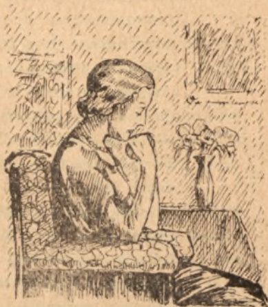
rys. T. Skowroński

Dzisiaj miały się spotkać, aby opowiedzieć sobie co przeżyły przez ten długi okres rozłąki. Zagłębiała we wspomnieniach pani Maria nie usłyszała ani zajeżdżającego samochodu, ani otwierania