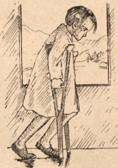
rys. T. Skowroński

Mocodajne słońce. Zdrowie dające powietrze.