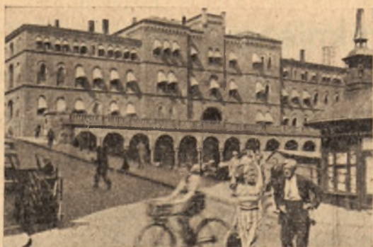
Norwegia — Oslo