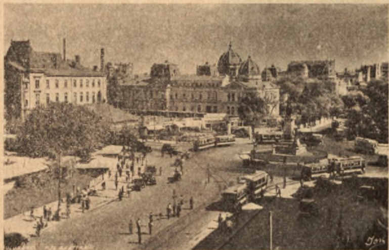
BUKARESZT — Skwer Bratianu

Godzina 23 30 . Na dworze leje tak energicznie jakby to nie był krakowski deszcz. Ten ostatni jest przecież ospały i systematyczny. Ulice opustoszałe lśnią mokrym asfaltem rozpryskującym na sobie promyki