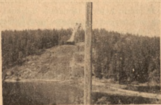
Norwegia — Holmenkollen