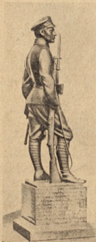
Legionista (bronz, 1916)