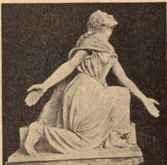
Część projektu Antepedjum ołtarzowego

Rozwój Koniecznego — rzeźbiarza szedł niewątpliwie drogą od realizmu do własnej formy, może do klasycyzmu, jeżeli mam już użyć określenia przyjętego i zrozumiałego dziś ogólnie. Jego wewnętrzne przeżycia i emocje znajdowały ujście nie tylko w rzeźbie, ale i w poezji i w grafice, a niemniej też w działalności poza sztuką.