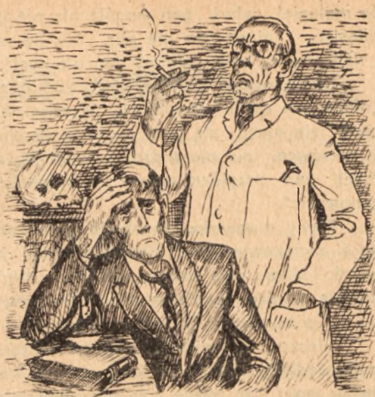
Rys. T. Skowroński

„Bardzo być może”, powiada doktor, jakby olśniony inną wielką ideą, która mu przyszła na myśl, „że mamy tu infiltrację na proscenium”.