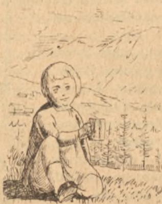
rys. T. Skowroński

Lustro nad usztywnioną główką odbija tęczowe urojenia a te wypełni inny czarodziej — Słońce.