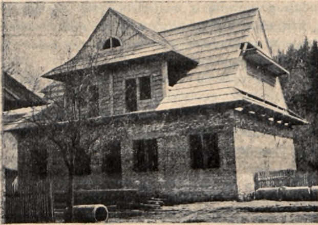
Dom Ludowy w Łąpszach Niżnych w stadium budowy.

Dzieło to, prowadzone wytrwale i mozolną pracą ludu spiskiego, częściowo doprowadzono do celu, dzisiaj mury stoją już pod dachem, trzeba tylko dokończyć rozpoczętą pracę.