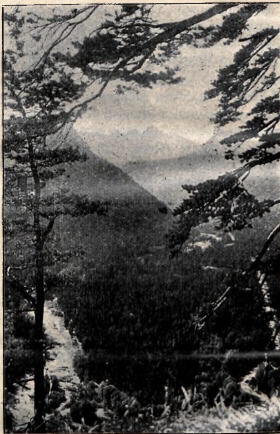
Rodzime sosny na „Skalce” nad Białką.

Całe Pieniny, stanowiące Park Narodowy, staną się niezwykłą atrakcją dla licznych rzeszy turystów i narciarzy w nadchodzącym sezonie zimowym.