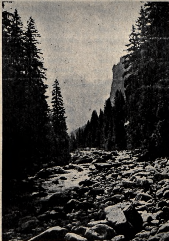
Piękny Widok Doliny Białej Wody w Tatrach.

Powracająca ludność jest tą samą, jaką była za pradziadów.