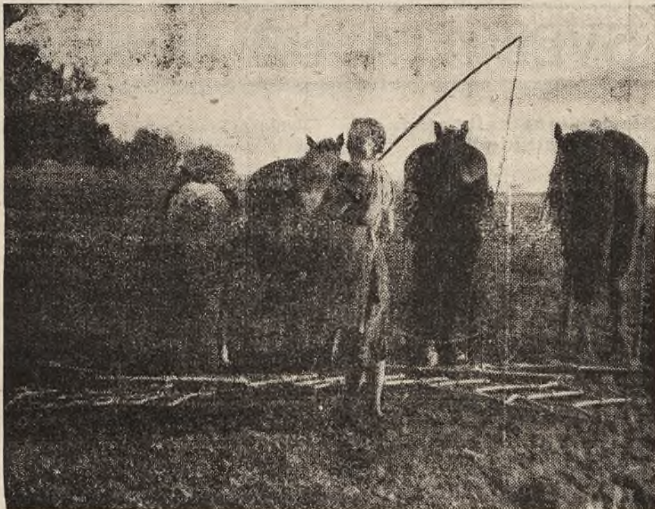
Gražus vasaros ūkio darbų vaizdas Klaipėdos krašte

Čia apie vištų laikymą kartu su kitais gyvuliais tvartuose arba su žmonėmis pirkiose visai nekalbame, nes tokis vištų laikymo būdas yra atgyvenęs savo amžių ir reikia kuo greičiausiai jį pamesti, kur jis dar yra užsilikęs. M. Č.