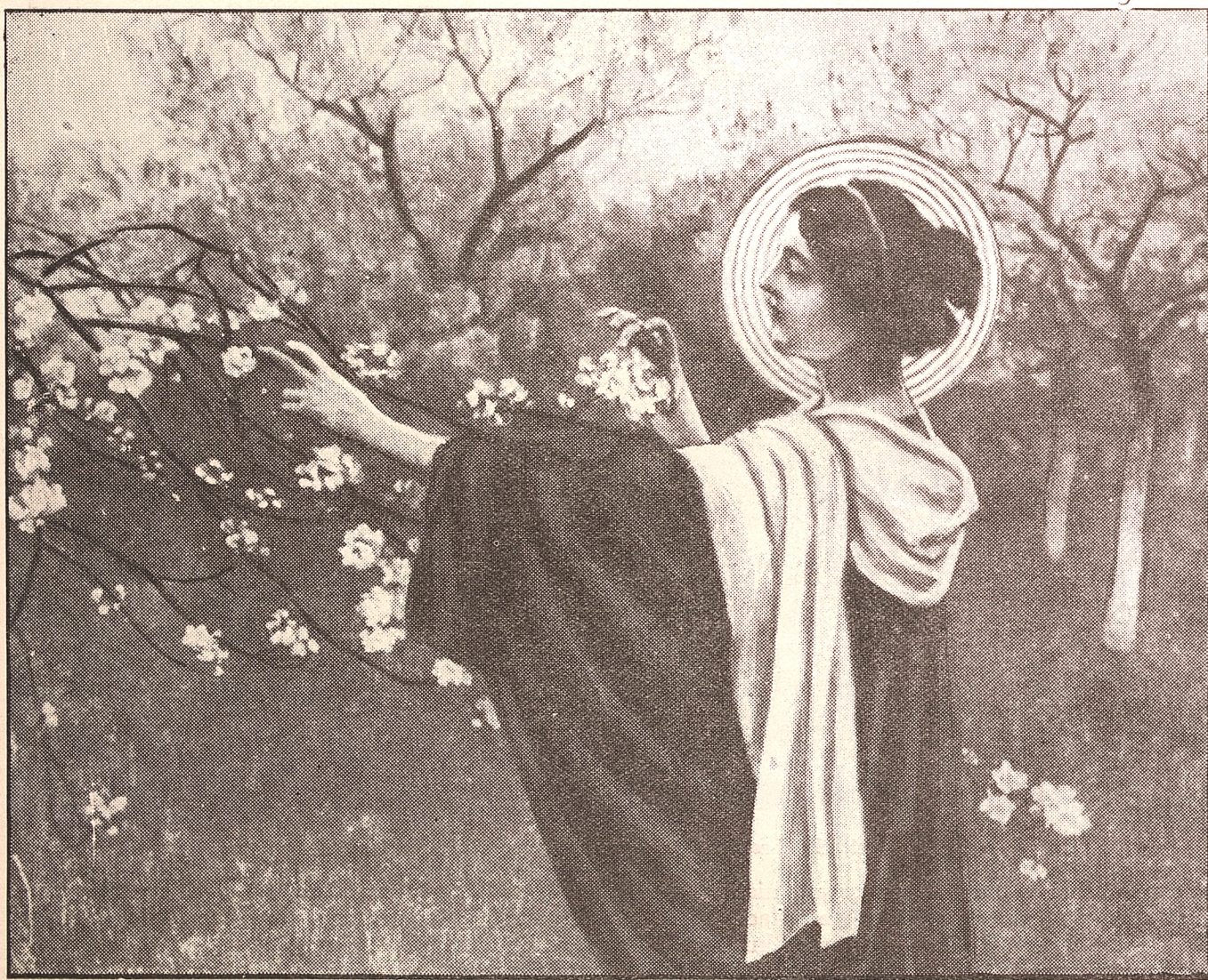
Święta Zofia — Pączki rozwija.

Maj, to najpiękniejszy okres wiosny — pora kwitnienia sadów i porastania pól bujną runią zieloną. Kwitną jabłonie, grusze, wiśnie, czeremchy, kasztany, akacje, bzy, — złote irysy nad rowami, a liliowe po ogrodach, — łąki niebieszczą się od niezapominajek i barwią się na amarantowo od firletek. Blando-różowy obłok kwiecica otula sady — zamienia-