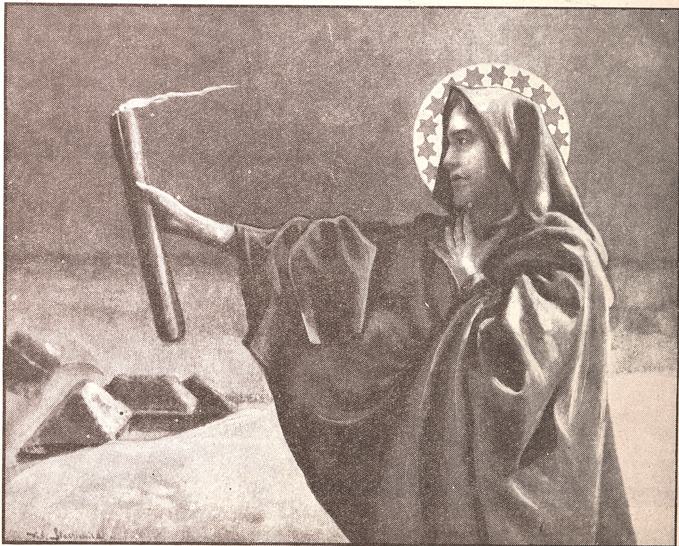
Jak Matka Boska gromnicą zaświeci — To wilk od zagrody do lasu poleci.

Najwyższą cześć oddawali Polacy oddawna Najświętszej Maryi Pannie. Wszystkie święta Bogarodzicy obchodził naród uroczyście. Święto Oczyszczenia, najuroczyściej ze wszystkich obchodzone, nazywa się Matką Boską „Gromniczną”. W kościele bowiem, jak wiadomo, w dniu tym poświęcano świece woskowe, zwane gromnicami, które przytomni trzymali w kościele w czasie nabożeństwa. Świece te, zapalano w czasie burzy i gromów, jako ochronę od niebezpieczeństwa, a przede wszystkim, jako znak gotowości na śmierć.