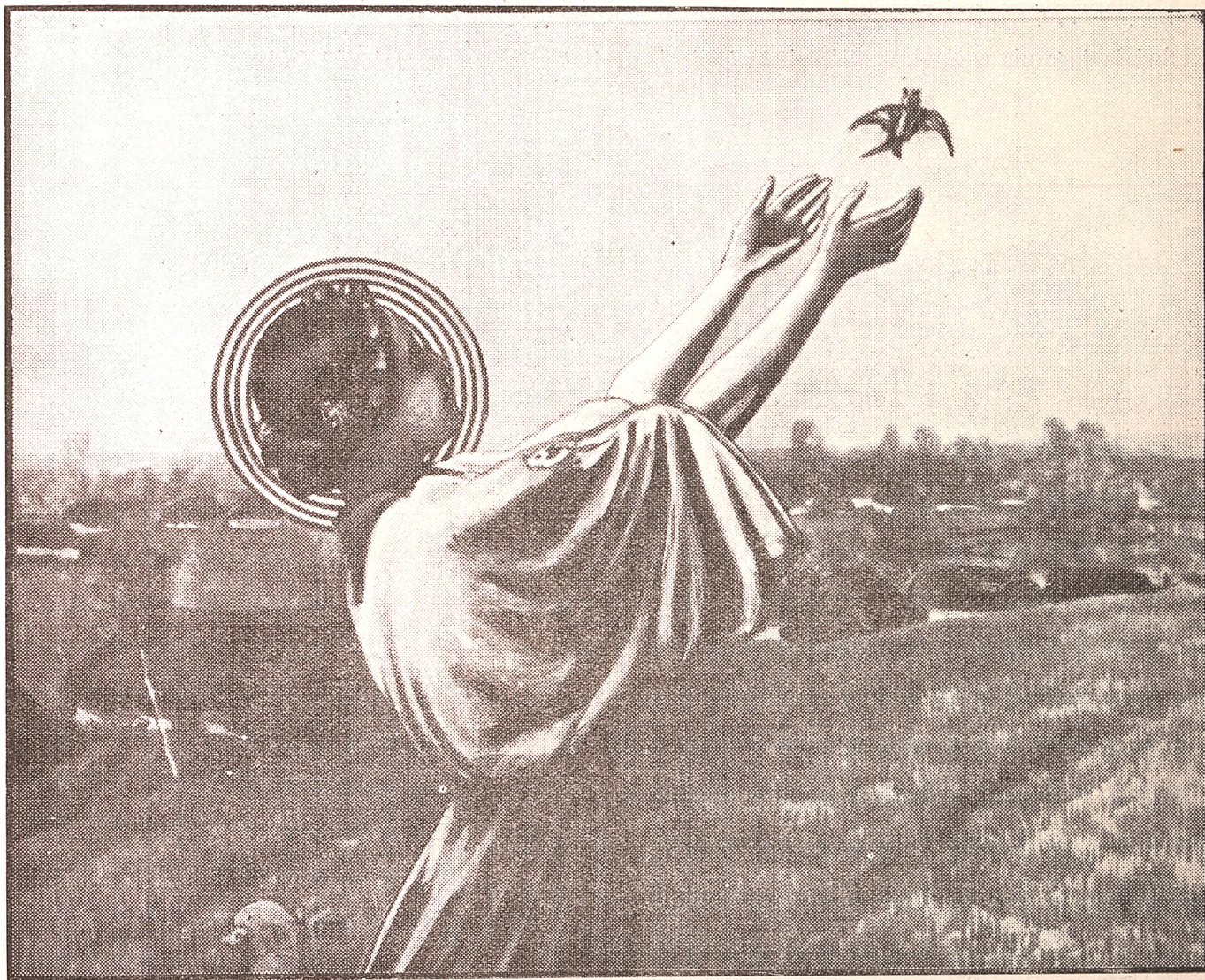
Święta Agnieszka Łaskawa — Wypuszcza skowronka z rękawa,

Leć skowronku w błękitne, przeczyste niebios — hen pod otchłanną kopułę wiosennego pałacu, gdzie złocista lampa słońca płonie! — Śpiewaj ku chwale Boga hymn dziękczynny, — wydzwaniaj pieśń rados- ną, że wiosna, — ta upragniona, precudna wiosen- ka — królowa, już przysła i w pałacu przezroczy- stym, kąpiącym od złota promieni słonecznych, — aa tronie z zielonych aksamitów uwitym, zasiadła Szata na niej mieni się perłami rosy i brylantami kro- pelek strumyków, nóżki jej spoczywają na dywanie, utkanym z fijołków i sasek liliowych, z białych śniegoliczek i żółtych, jak topazy, kaczeńców.