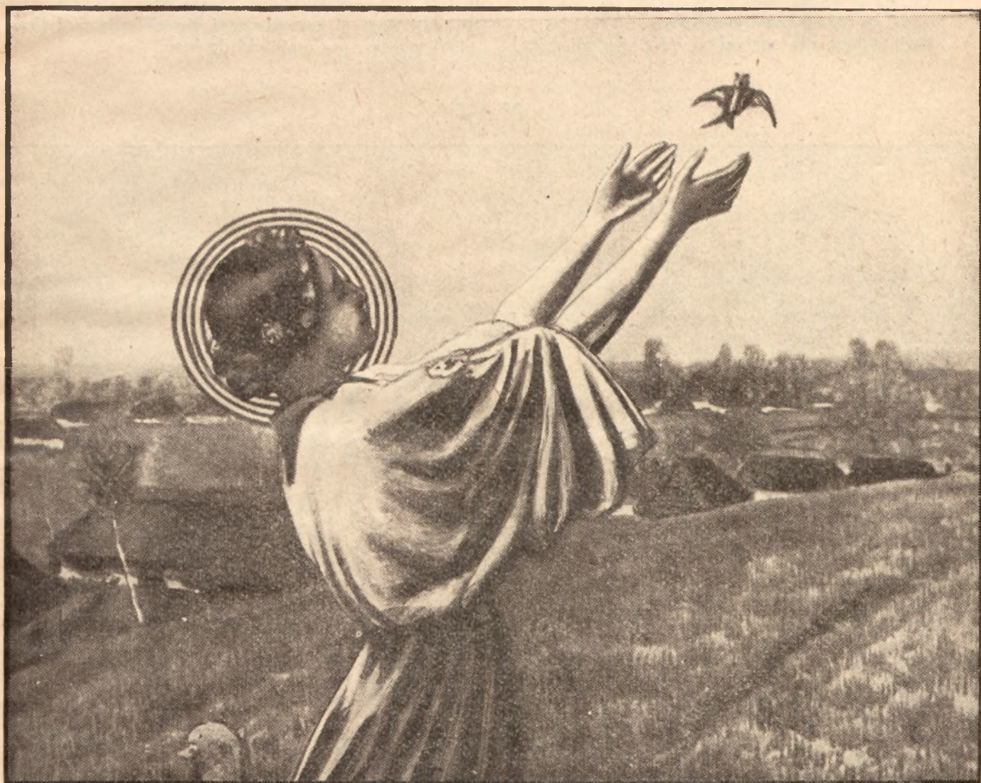
Święta Agnieszka Łaskawa — Wypuszcza skowronka z rękawa.

Leć skowronku w błękitne, przeczyste niebiosy — hen pod otchłanną kopułę wiosennego pałacu, gdzie żłocista lampa słońca płonie! — Śpiewaj ku chwale Boga hymn dziękczynny, — wydzwaniaj pieśń rados- ną, że wiosna, — ta upragniona, przecudna wiosen- ka — królowna, już przyszła i w pałacu przezroczy- stym, kapiącym od złota promieni słonecznych, — na tronie z zielonych aksamitów uwitym, zasiadła Szata na niej mieni się perlami rosy i brylantami kro- pelek strumyków, nóżki jej spoczywają na dywanie, utkanym z fijołków i sasanek liliowych, z białych śniegoliczek i żółtych, jak topazy, kaczeńców.