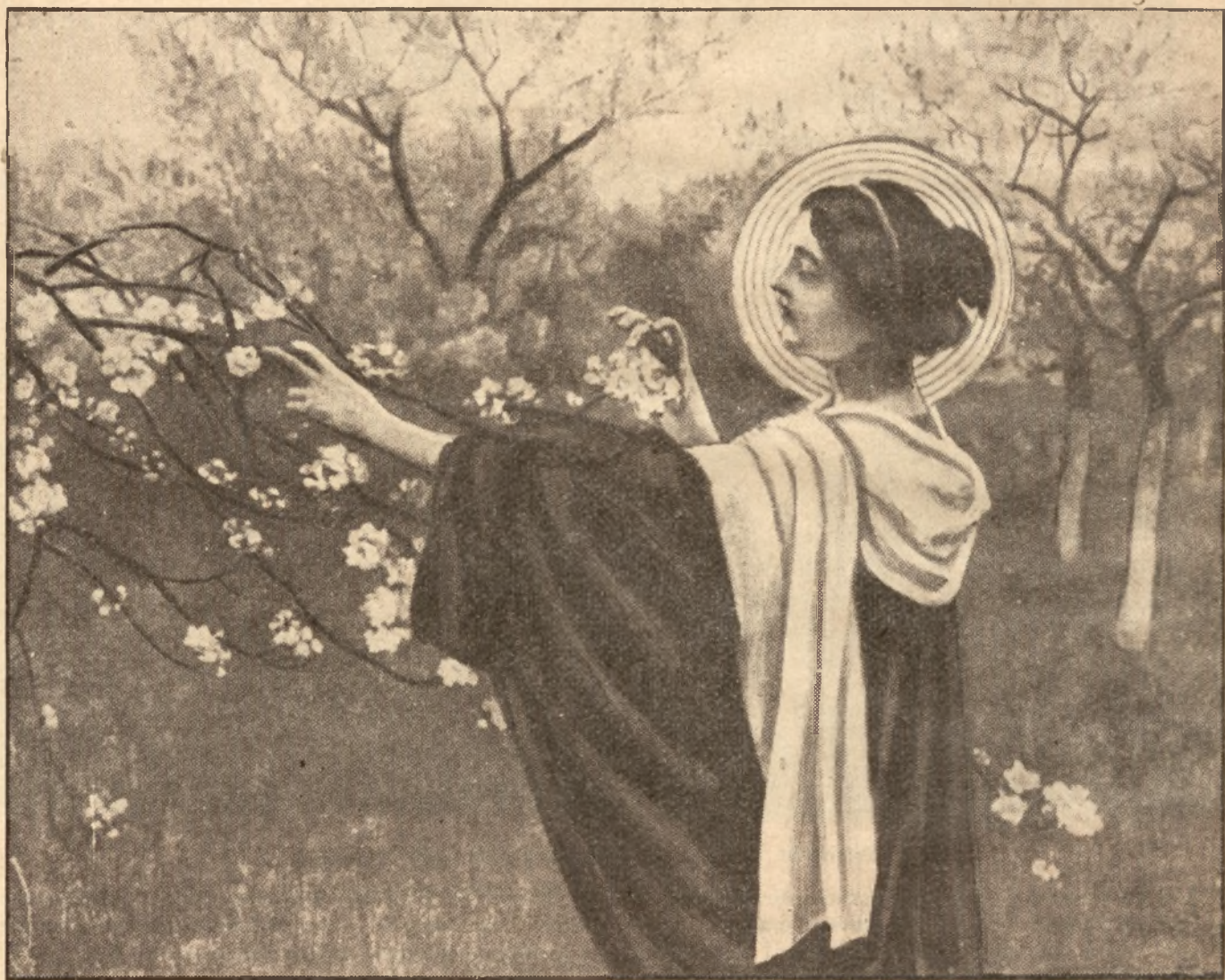
Święta Zolija — Pączki rozwija.

Maj, to najpiękniejszy okres wiosny — pora kwitnienia sadów i porastania pól bujną runią zieloną. Kwitną jabłonie, grusze, wiśnie, czeremchy, kasztany, akacje, bzy, — złote irysy nad rowami, a liliowe po ogrodach, — łąki niebieszczą się od niezapominajek i barwią się na amarantowo od firletek. Błado-różowy obłok kwiecica otula sady — zamienia-