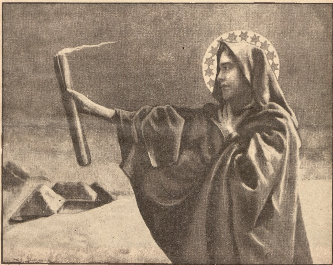
Jak Matka Boska gromnicą zaświeci — To wilk od zagrody do lasu poleci.

Najwyższą cześć oddawali Polacy oddawna Najświętszej Maryi Pannie. Wszystkie święta Bogarodzicy obchodził naród uroczyście. Święto Oczyszczenia, najuroczyściej ze wszystkich obchodzone, nazywa się Matką Boską „Gromniczną”. W kościele bowiem, jak wiadomo, w dniu tym poświęcano świece woskowe, zwane gromnicami, które przytomni trzymali w kościele w czasie nabożeństwa. Świece te, zapalano w czasie burzy i gromów, jako ochronę od niebezpieczeństwa, a przede wszystkim, jako znak gotowości na śmierć.