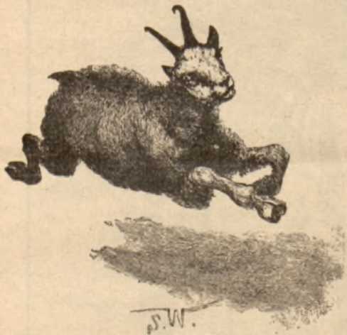
Kozica. — Rys. St. Witkiewicz.