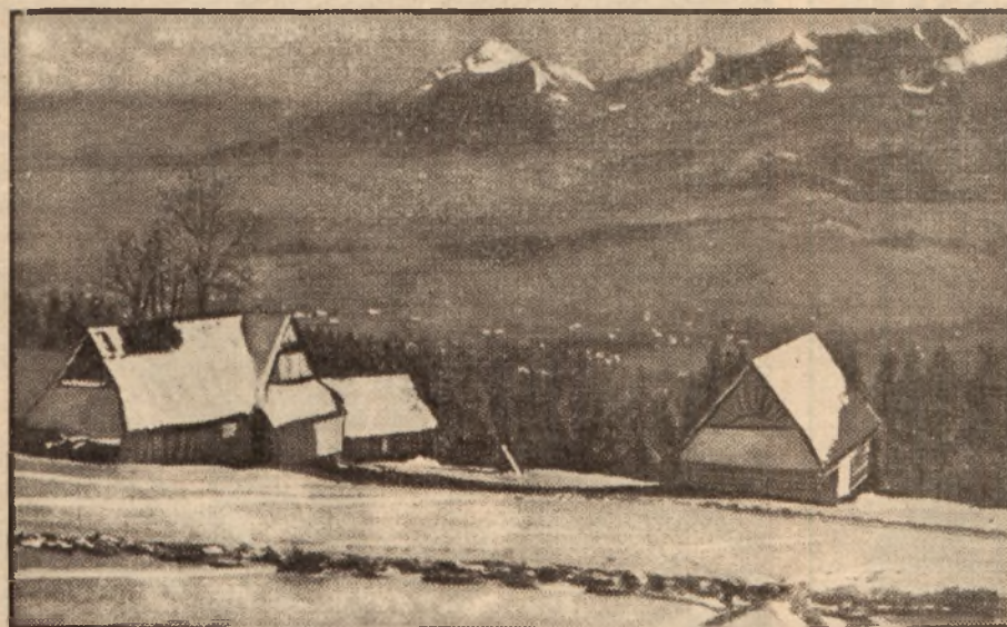
Widok z Sabałówki na Tatry Wysokie.

letniego doświadczenia skupił promienie swych myśli i umiłowań, oraz jakby testamentem jego rozumu i serca. Cykl nowel „Z Tatr” pisany jest piękną gwarą podhalańską.