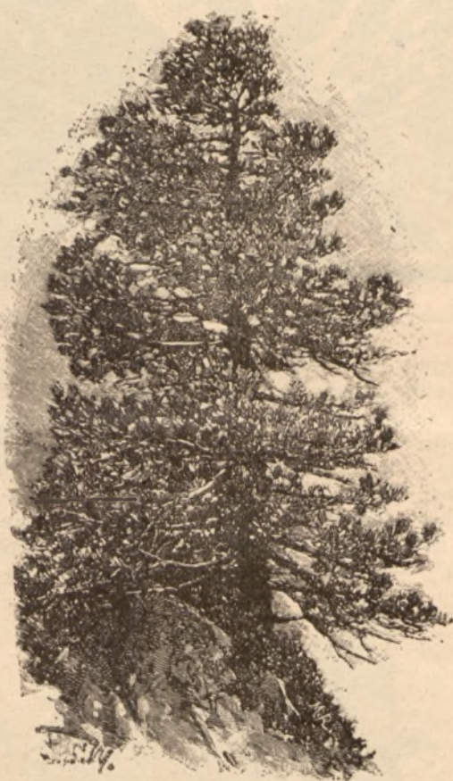
Limba. — Rys. St. Witkiewicz.