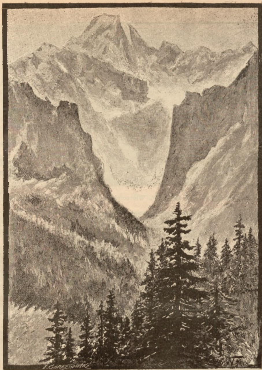
Garluch. — Rys. St. Witkiewicz.