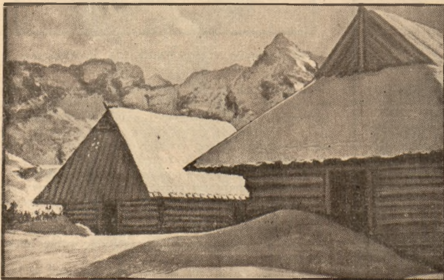
Szałasy na Hali Gąsienicowej.

trach", „Owce we mgle" i t. d. można oglądać przeważnie w Muzeum Narodowym w Krakowie.