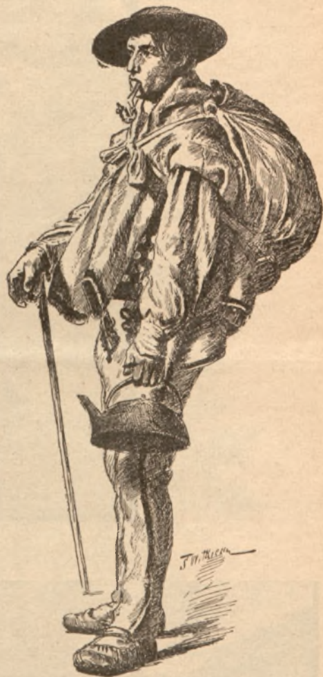
Przewodnik. — Rys. St. Witkiewicz.

Lecz najważniejszą i wiekopomną zasługą Witkiewicza było to, że stał się on pionierem stylu zakopiańskiego, który stworzył na wzór budownictwa i zdobnictwa podhalańskiego. W ten sposób ucieleśnił on wizję jasnowidzenia przedwcześnie zgasłego w r. 1837 poety Cypriana Norwida, który