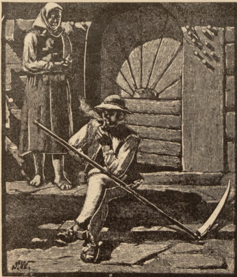
Przed chatą góralską. — Rys. St. Witkiewicz.

Ktokolwiek chciałby bliżej zapoznać się z postacią Witkiewicza, winien przestudiować podstawową o nim książkę Kazimierza Kosińskiego, wydaną staraniem Komitetu Witkiewiczowskiego w Warszawie. To cenne dzieło winno znaleźć się w każdej bibliotece polskiej, gdyż bije z niego nie tylko miłość do wielkiego artysty, ale i jest ono charakterystyką ówczesnych prądów artystycznych.