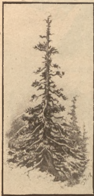
Smerek halny. — Rys. St. Witkiewicz.

na legendą tatrzańską i żywą arką przymierza między dawnymi i młodszymi laty, gdyż w nim skupiła się cała epopea zakopiańska. Jego opowiadania, bajki, muzyka, talent narracyjny i własne górskie przeżycia, czyniły zeń w oczach Witkiewicza rapsodię dawnych bohaterskich czasów Podhala. „Sabała” — pisze o nim Witkiewicz w „Na Przełęczy” i w „Po Latach” — „stary myśliwiec, morderca nie-