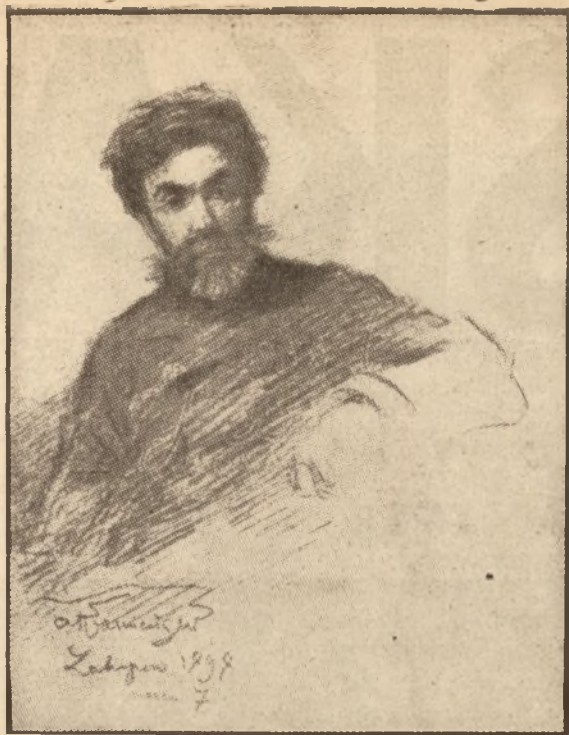
St. Witkiewicz ur. 1851, zm. 1915 r.

12-letnie pacholę brał pośredni udział w Powstaniu Styczniowym, przekradając się do lasów, by dostarczać ukrytej w nim braci powstańczej broni, amunicji i prowiantów. Ojciec jego i dwaj starsi bracia walczyli już w oddziałach, a matka, entuzjastka sprawy narodowej, cały dom oddała na usługi powstańców. Toteż, gdy przyszła klęska przegranej, Moskałe skonfiskowali Witkiewiczom majątek rodzinny, a za zesłanym na wygnanie do Tobolska mężem, podążyła na Sybir i żona, zabrawszy ze sobą młodsze dzieci. Te lata wygnania stały się dla młodocianego Stanisława Witkiewicza „najcudniej-