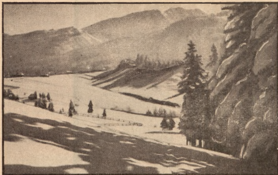
Widok z Zakopanego.