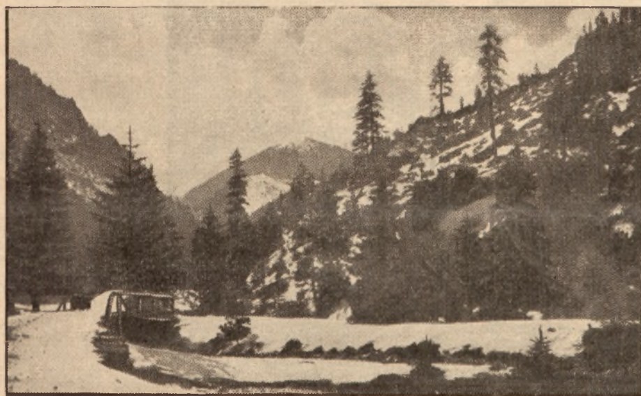
Dolina Chocholowska.