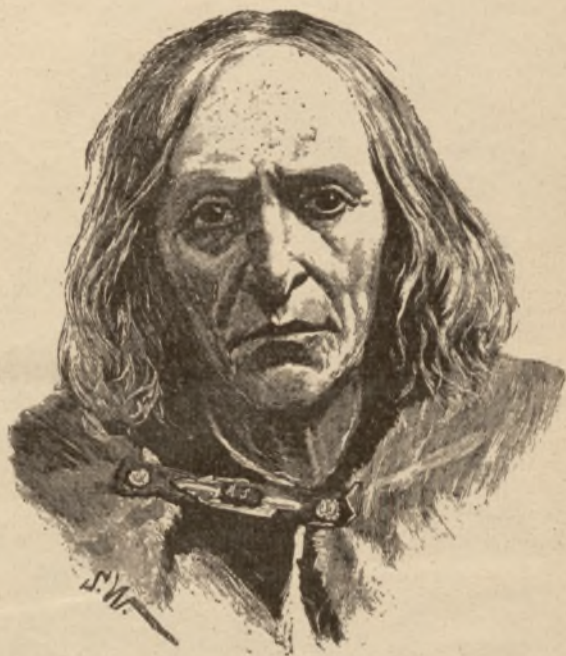
Sabała — Rys. St. Witkiewicz.

Poczuwszy w sobie iskrę talentu boskiego, studiuje Witkiewicz malarstwo w Akademii Sztuk Pięknych w Petersburgu, lecz zrażony panującym tam formalizmem, wyjeżdża do Warszawy, a następnie