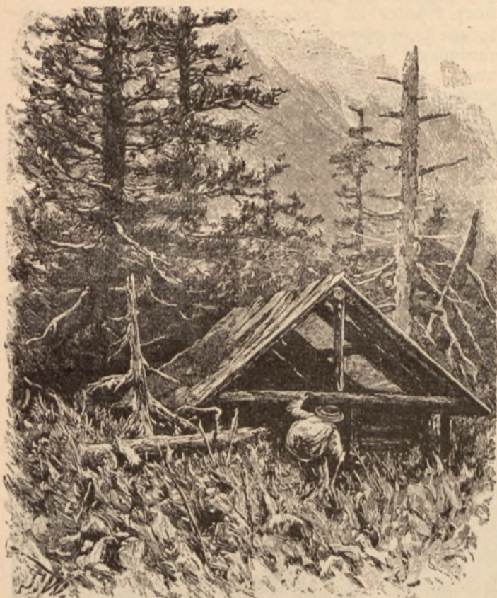
Szalas pasterski. — Rys. St. Witkiewicz.

zwierzęcia, aby można je było zakonserwować całe dla najdalszych pokoleń. Gdy wyginęły już prawie w górach maki halne, zaczął ich hodowlę w domu, a następnie rozsiewał je przez najsprawniejszych górali po górach. Nic też dziwnego, że podobnie pragnął podtrzymać i tamtejszą sztukę ludową i że był wrogiem wszelkich pomysłów, któreby pełną tajemniczej grozy pustynię tatrzańską zamieniały w park, co jego zdaniem równałoby się śmierci Tatr.