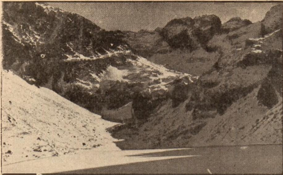
Czarny Staw Gąsienicowy w zimie.