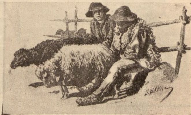
Dojenie owiec. — Rys. St. Witkiewicz.