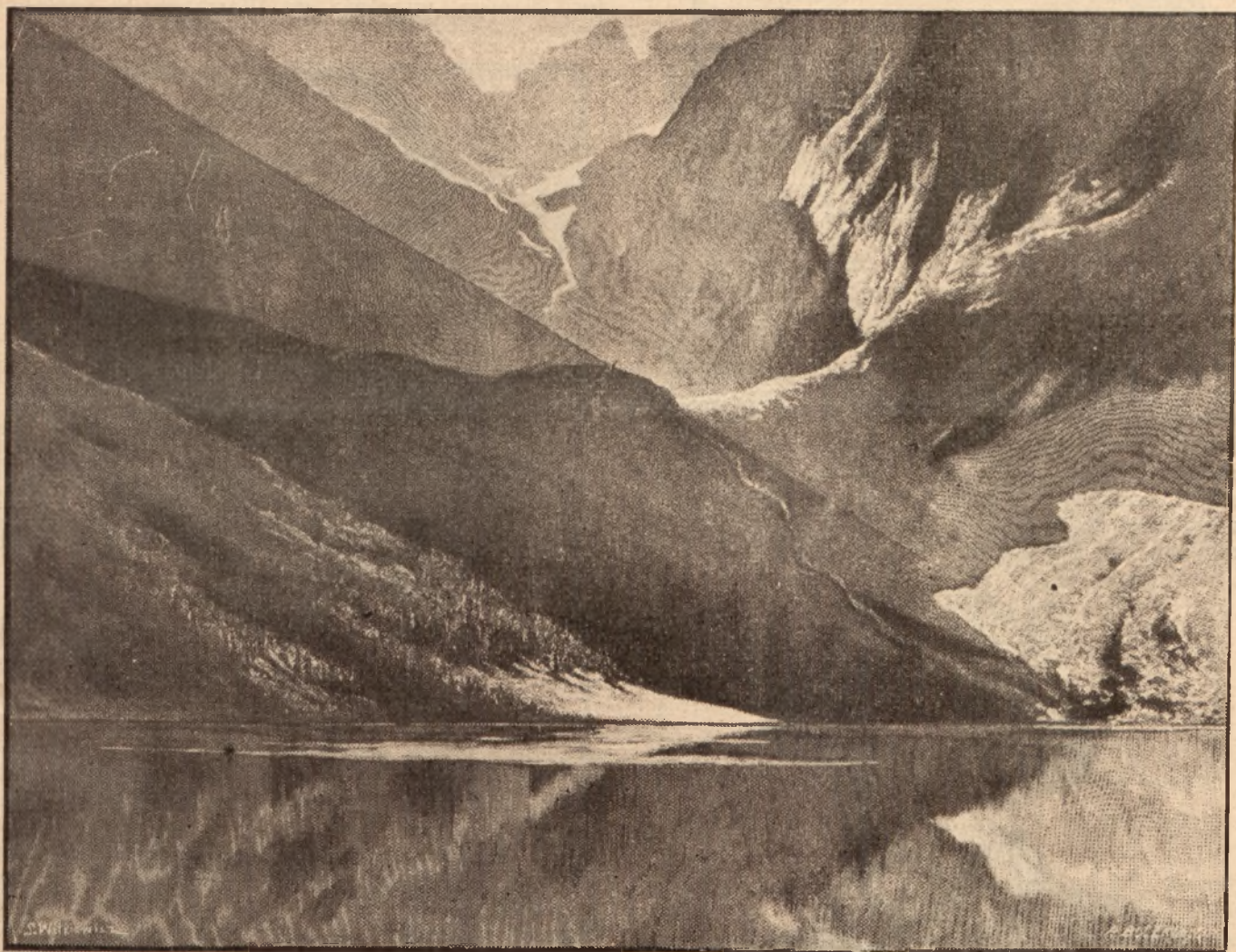
Morskie Oko — Rys. St. Witkiewicz.

S T. W I T K I E W I C Z E W A N G E L I S T A T A T R