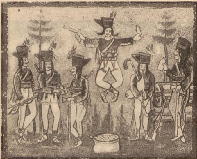
Obraz góralski na szkle. „Janosik”.