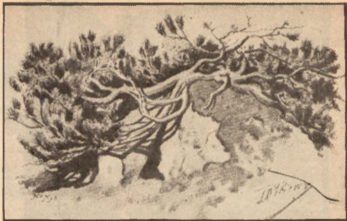
Kosodrzewina. — Rys. St. Witkiewicz.

Identyczny rys ukochania Tatr posiadał w całej pełni i Witkiewicz, pragnął on, aby nie uroniły one ani jednego kwiatu, ani jednego drzewa lub