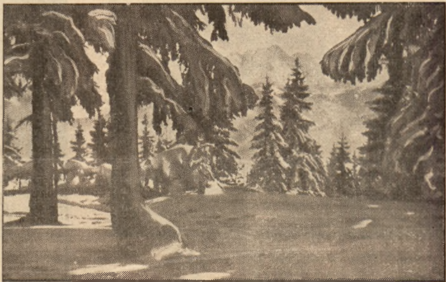
Widok na Świnicę.