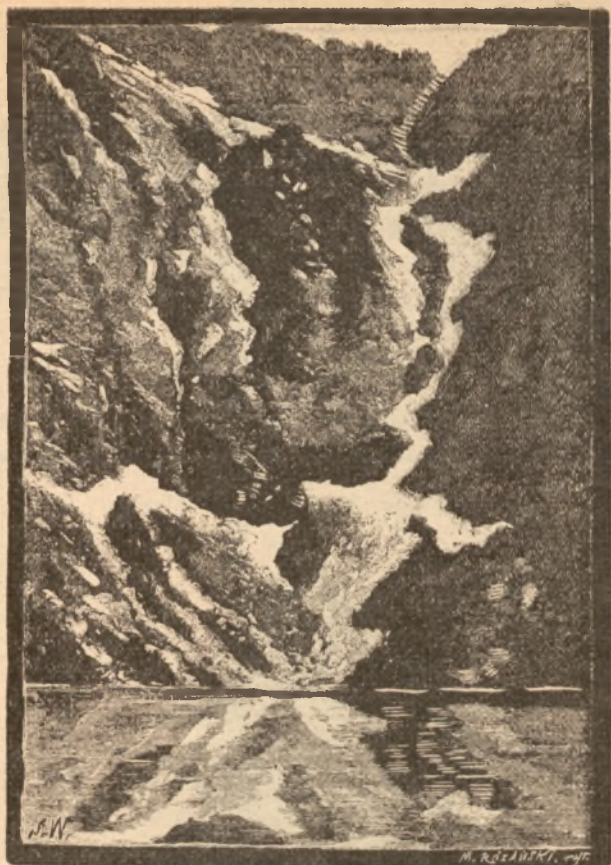
Czarny Staw pod Rysami.