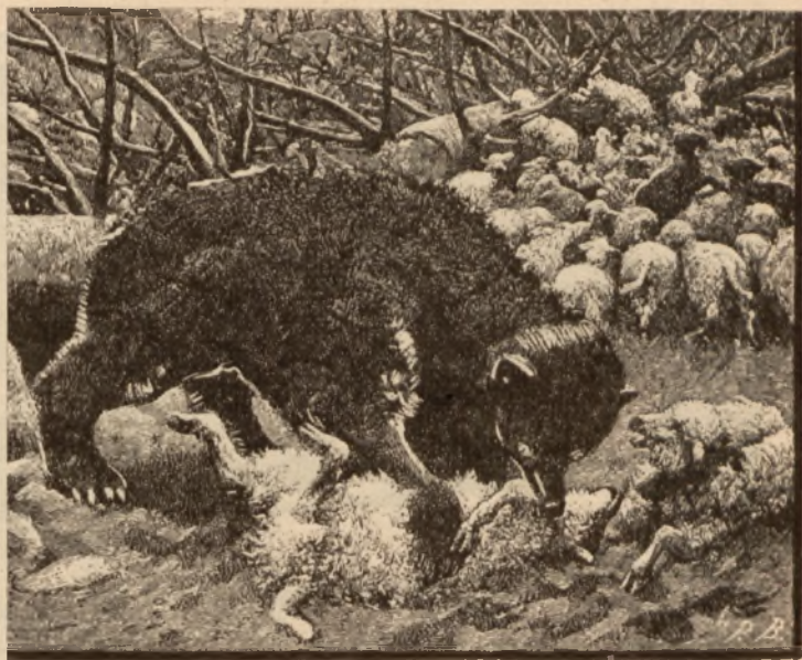
Rys. St. Witkiewicz,