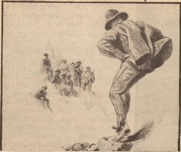
Juhas tańczący — Rys. St. Witkiewicz.