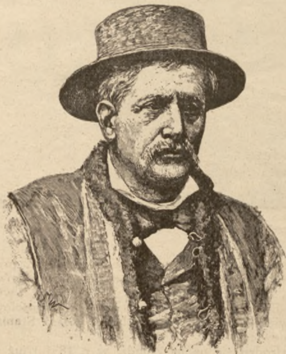
Dr. T. Chałubiński — Rys. St. Witkiewicz.

12-letnie pacholę brał pośredni udział w Powstaniu Styczniowym, przekradając się do lasów, by dostarczać ukrytej w nim braci powstańczej broni, amunicji i prowiantów. Ojciec jego i dwaj starsi bracia walczyli już w oddziałach, a matka, entuzjastka sprawy narodowej, cały dom oddała na usługi powstańców. Toteż, gdy przyszła klęska przegranej, Moskałe skonfiskowali Witkiewiczom majątek rodzinny, a za zesłanym na wygnanie do Tobolska mężem, podążyła na Sybir i żona, zabrawszy ze sobą młodsze dzieci. Te lata wygnania stały się dla młodocianego Stanisława Witkiewicza „najcudniej-