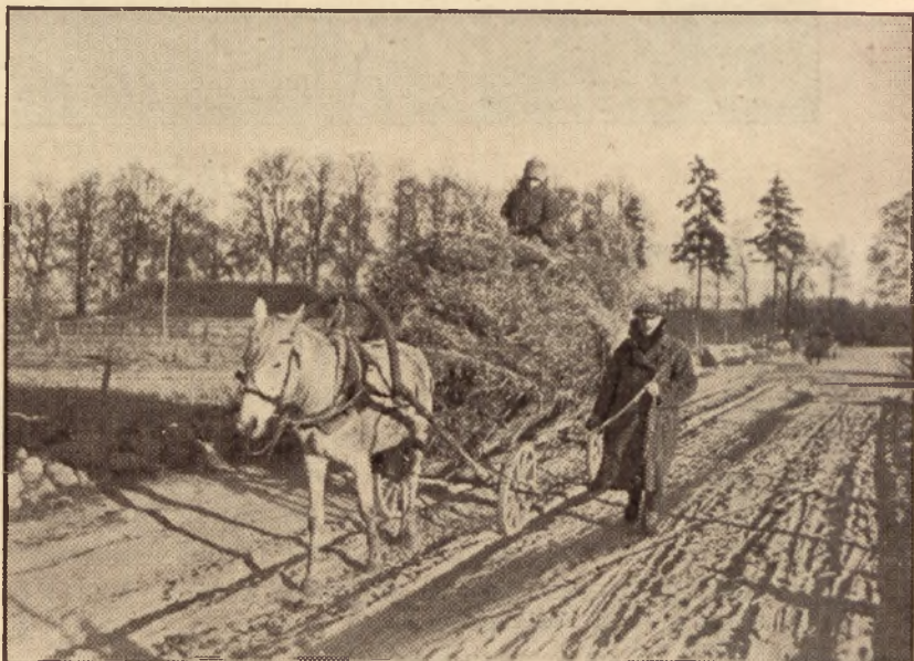
Ze ściółką z lasu.

Dzięki licznie wywożonym przetworom warzywniczym wzmógł się tej jesieni eksport polski. W tej dziedzinie zaznacza się stale wzrost naszego eksportu warzywniczego a nawet na rynkach zagranicznych zdołał zaznaczyć swą egzystencję produktami pierwszej jakości, a w kraju wzbudzić