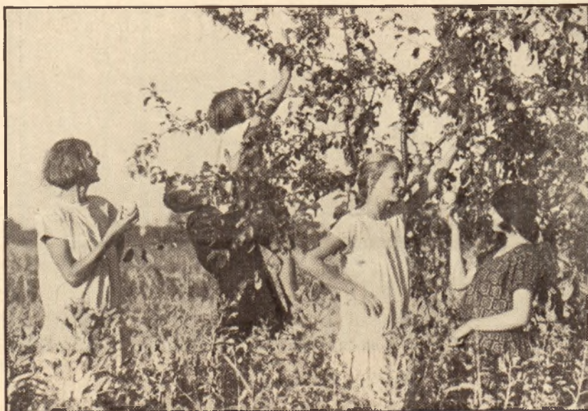
Przy zbiórce owoców.

Melancholia i smutek wkradają się do duszy. Wtórują im wichry jesienne, szamocące gałęziami drzew. Las jak i w lecie stoi piękny, majestatyczny, pełen wieku i siły. Wśród wyniosłych sosen brzozy tylko jaśniej rozplecionym włosom, a inne drzewa tulą się do siebie koronami, że słońce z trudem pełza po zrudziałych mchach i paprociach. Obok,