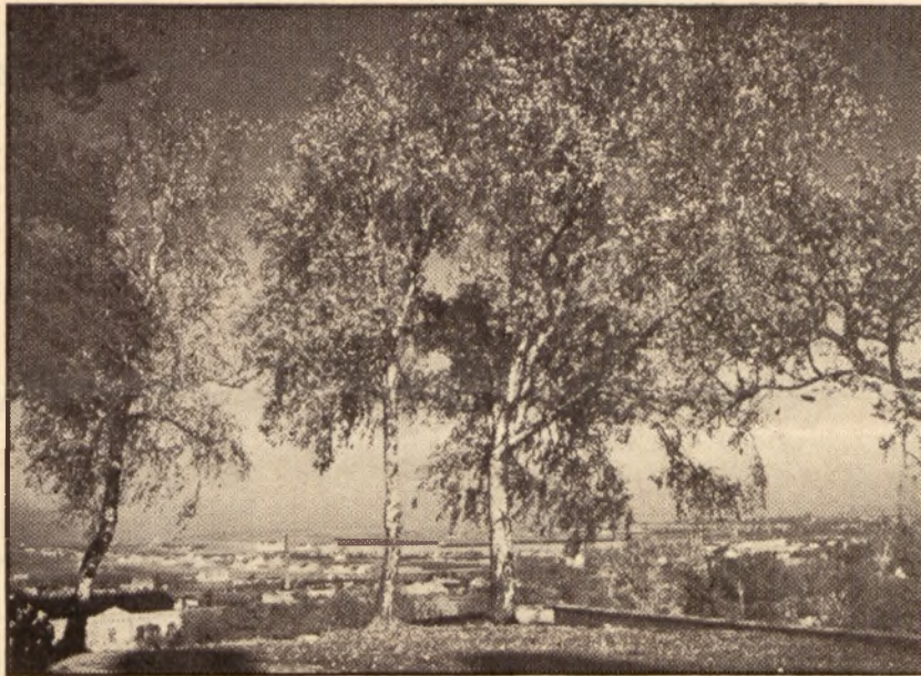
„Żółte listki brzoź dygocą, dygocą“.

orle nie zważało. Często nocą, na mroźnym wicherze listopadowym, na deszczu i śniegu trwało na placówce. Toteż w dniach listopadowych młodzież lwowska broniła swego grodu. Gdy jeden padł ugodzony śmiertelnie, zastępował go drugi, takich przykładów było mnóstwo. Jesienne wieczory ogarniały ciemnością pozbawione światła miasto. Z daleka tylko widoczne były luno pożarów, lecz nikt