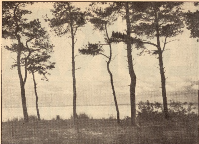
„W pożegnanie grają lasy”.

kie granatowe jagody czekają na pierwszy przymrozek. Nie słychać gwaru ptasząt. Odleciały w cieplejsze strony. Pusto w lesie, czasem tylko można spotkać zmarznięte, szczelnie otulone chustką kobiety, które zbierają suche gałęzie—chróst—i dźwigają ten ciężar na plecach, nie czując wcale chłodu. To jedyny sposób zabezpieczenia się przed zimnem w niewielkiej drewnianej chacie. Poza tym w lesie zbiera się liście i igliwie jako ściółkę, które zwłaszcza w tym roku wskutek suszy musi zastąpić słomę na podściół. To przygotowanie na ostrzejsze dni zimy. A w głębi lasu zwierzęta rozpoczynają swe polowania — lub przygotowują swe leża zimowe. Las jesienią wabi przede wszystkim myśliwych. Rozpoczyna się sezon łowów, którym nasi przodkowie niegdyś hołowali. Zwierzyny było wówczas podostatkiem, więc każdy mógł łowić, ponieważ zwierzyna była niczyja. W łowach zamięłowanie miało wielu królów polskich od Bolesława Chrobrego, wielkiego myśliwego, aż po Stanisława Augusta, który w poszumie starych borów szukał ukojenia w chwilach trosk i zmartwień.