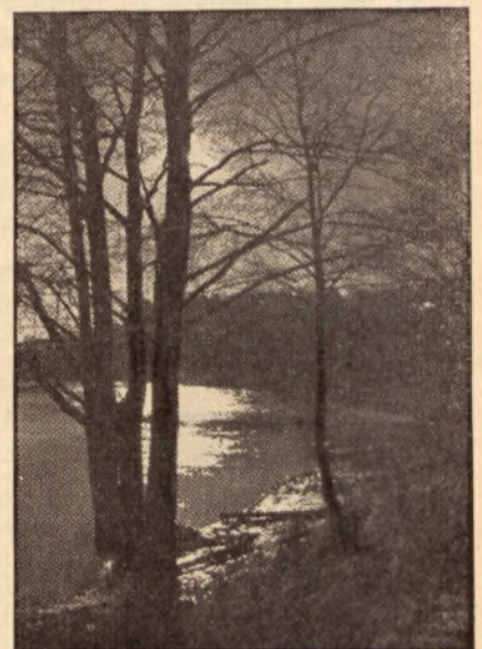
Wieczór nad jeziorem.

Zabiegi wróżebne wykonywane w wieczór wigilijny św. Andrzeja są bardzo różnorodne i bogate. Najpospolitszą wróżbą jest np. lanie z wosku, a w zamożniejszych domach cyny lub ołowiu. Szczególniej zna-