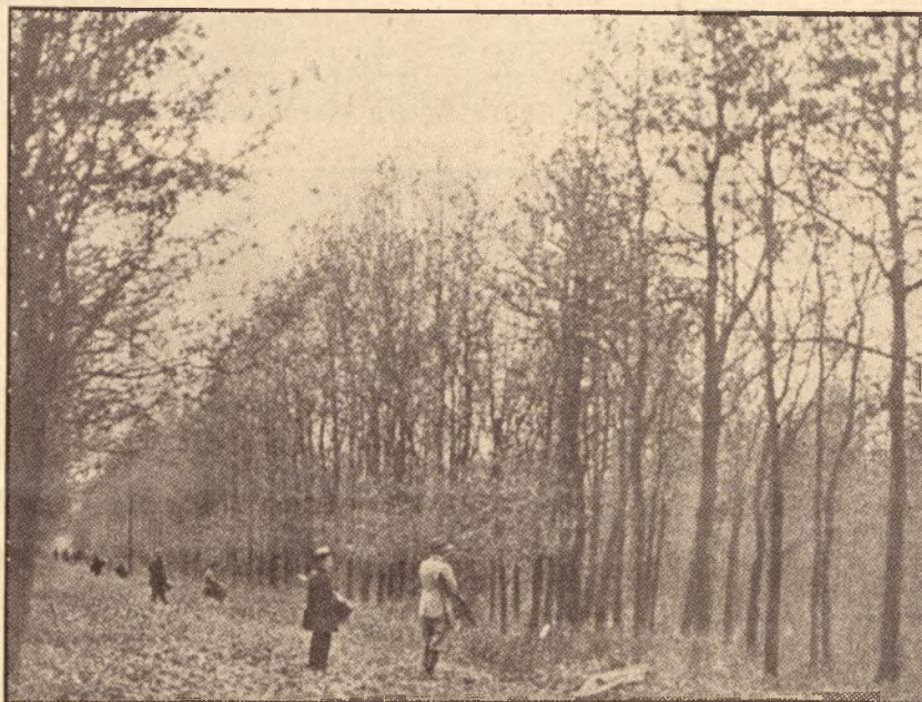
Pierwsze jesienne polowanie.

Najbardziej przywiązany jest lud do przysłowia, dotyczących pogody. Wierzą nasi wieśniacy, że jaki np. dzień Narodzenia Matki Boskiej, takich będzie następnych dni czterdzieści, a za najlepszy czas do siewu uważano czas około święta Matki Boskiej Siewnej. Pięknie wygląda chłop polski przy tym siewie. Wygląda tak, jak go opisał Reymont. Taką też wydaje się w legendzie Matka Boska, kiedy to podobno chodziła po polskich bródach zornych i siała ręką z płachty, przewiązanej u pasa. Ten prastary sposób siania często się jeszcze w naszych wsiach spotyka, chociaż zamożniejsi właścianie posługują się już maszynami - siewnikami. Rzucają rolnicy ziarno — przyszłą nadzieję — w ziemię — a za swą pracę, za swój pot i trudy z przyszłą wiosną będą się cieszyć łanami zboża, droższego mu niż złoto.