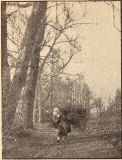
Pod brzemieniem chróstu.

czy szare mgły, otulające świat, radość i melancholia, płynące z opustoszałych pól i ogołoconych drzew, wszystko to stanowi część naszej duszy i stanowi jakąś więź tajemniczą, która nas wszystkich rozproszonych po świecie łączy w jeden naród.