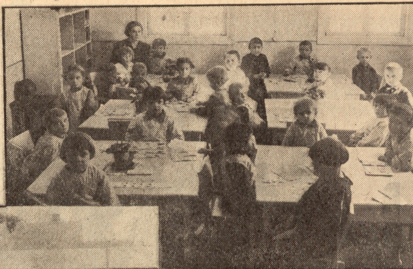
Aby pobladłe twarzyczki dzieci nabrały rumieńców zdrowia...

Kobiety, zrzeszone w tej organizacji, prowadzą wielostronną działalność, w której przejawia się wielkoduszność dawnych Polek,