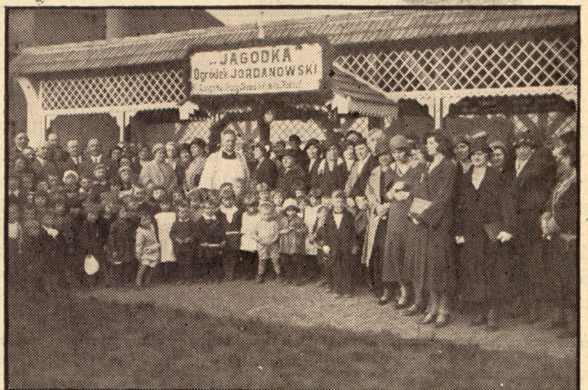
Wyszkolone przez Związek instruktorki prowadzą ogórki jordanowskie.

Kobiety żywo interesują się wychowaniem fizycznym na terenie swoich placówek. Prowadzą więc obozy, kursy fachowe dla referen*