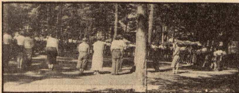
W bratnim kole na leśnej polanie.

Do uzyskania takiej pozycji gromnie przyczyniają się szkoły zawodowe.