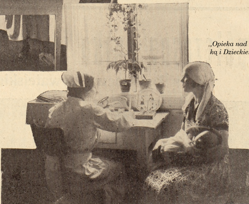
„Opieka nad Matką i Dzieckiem”.

na całopalną ofiarę dla uciśnionej Macierzy. Byli to (powstańcy z 1831 i 1863 roku, legionści, którzy wraz z Komendantem w rożkach strzeleckich walczyli o niepodległość, ci, co gromadnie zaciągali się w szeregi ochotnicze dla obrony kraju w 1920 roku, i całe masy mężów bohaterskich, choć nieznanymi.