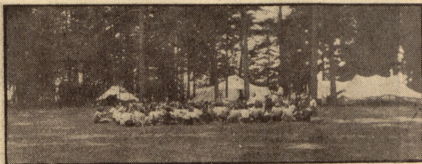
Również starsza młodzież, najbiedniejsza, wyczerpana ciężkim życiem w mieście, znajduje wypoczynek i nabiera sił — na licznych koloniach letnich.

Kobiety zorganizowane rozumieją, że tylko rozwój umysłowy,