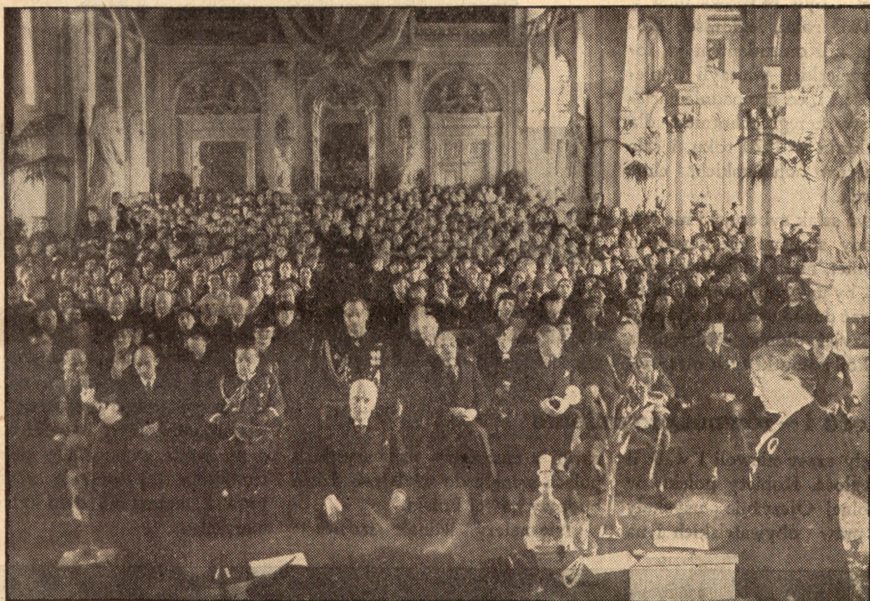
W roku bieżącym w sali Ratusza Warszawy, odbyła się uroczystość 10-lecia Związku Pracy Obywatelskiej Kobiet. Na zdjęciu (w środku widoczny Prezydent R. P. Prof. Ignacy Mościcki. Po prawej (na mównicy) Marszałkowa Aleksandra Piłsudska.