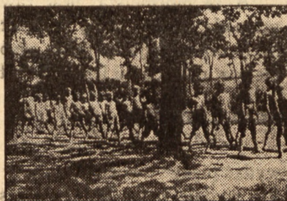
Dzieci, którymi dotąd nikt się nie zajmował, znajdują teraz opiekę.

podstawach i głębokim uświadomieniu o roli kobiety jako matki, żony, pracowniczki, pionierki, obywatelki itp. jak również o prawach jej należnych.