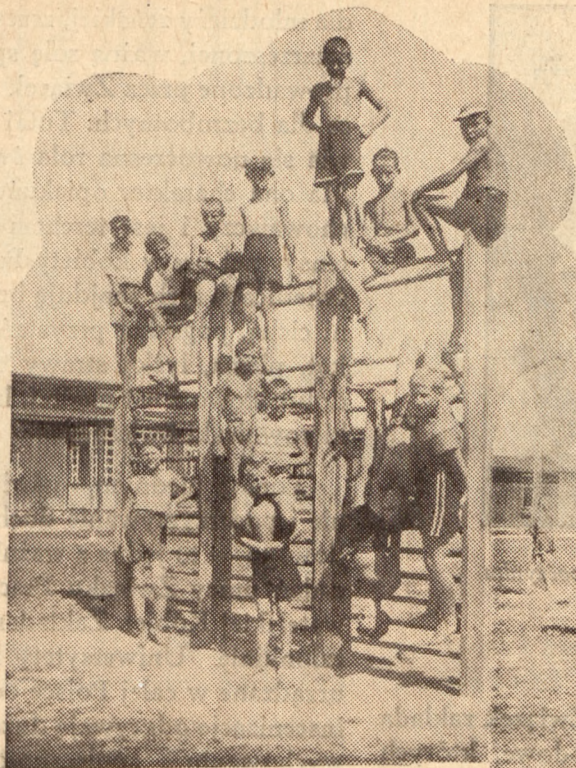
O zdrowie młodych obywateli.