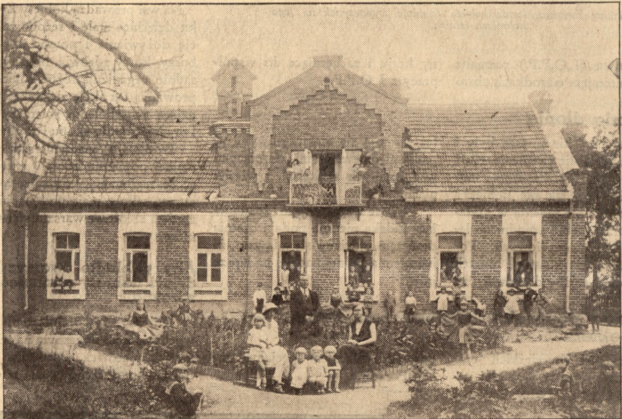
Kolonie letnie znajdują wygodne pomieszczenie w niezajętych przez lato budynkach szkolnych.

Pięknie rozbudowana praca Związku jest we Francji; skupiona w 59 oddziałach Związku, ma tam