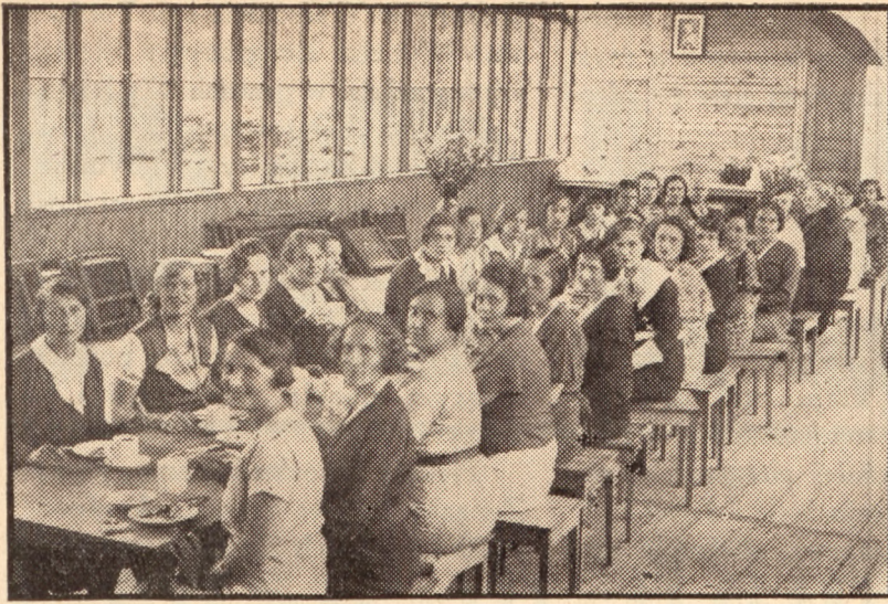
Dzięki staraniom Związku, każda kobieta znajduje wypoczynek na jego koloniach letnich.

nej Państwa (L.O.P.P.) rozmaite kursy, pouczające o środkach obro*