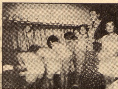
Kobiety żywo interesują się wychowaniem fizycznym. Jako instruktorki — prowadzą obozy i dopilnowują porządku i czystości.

zamurwane horyzonty, poruszyć najtkliwsze i najszlachetniejsze struny duszy ludzkiej! Ona więc jest tą wierną pomocnicą we wszelkich pracach. Trzeba nią zainteresować jak najszersze rzesze, niech stanie się przyjaciółką, nauczycielem i wytchnieniem.