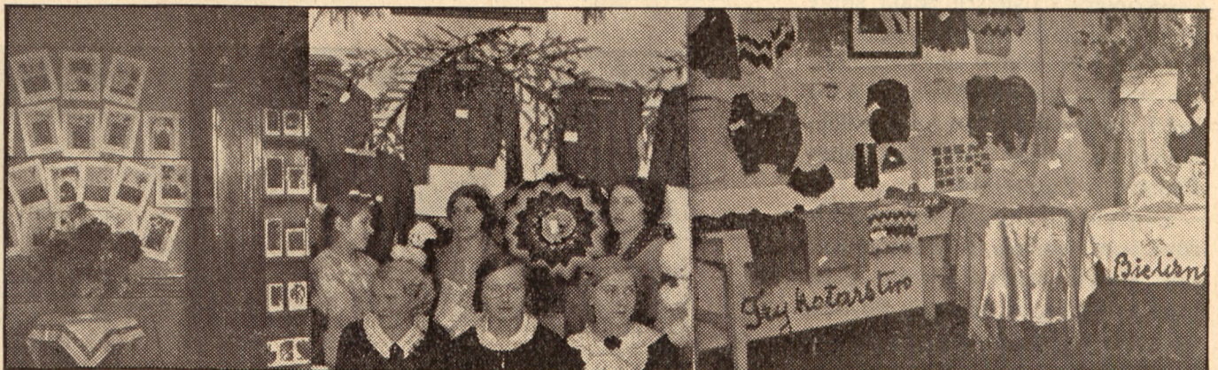
Corocznie organizowane wystawy różnego rodzaju, obrazują dorobek i pomysłowość kobiet zorganizowanych.

wydać piękne owoce. Rezultaty takiej wydatkuje praca kobiet, zrzeszonych w jednej z największych, bo