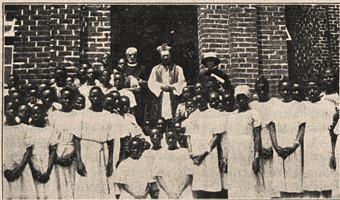
Chłopcy i dziewczęta po bierzmowaniu.

zus raczej się posługiwać i rzeczywiście tyle tylko zrobimy tutaj, zdziałamy, ile łaska Boża przez nas. Dlatego dziękując dołączam prośbę tak od siebie samego, jak i od nas wszystkich i Ojców i Braci i Sióstr, by Sodalicja wspierała nas i dalej, wzięła nas jakby za przedmiot swych gorących modlitw, których tutaj bardzo nam potrzeba, bo jak powiedziałem wyżej, bez łaski Bożej nic, a zadanie tak ważne — walka o królestwo Chrystusowe, rozszerzanie jego granic, a trudne — bo od początku, od