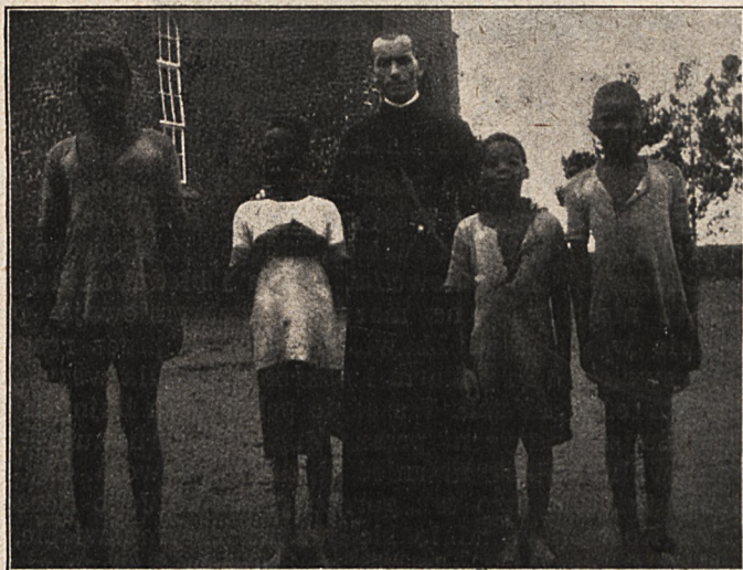
Pogańscy chłopcy, którzy uczęszczają na naukę do Ks. Zabdrya.

„List ten powinien już dawno być wysłany, ile że chodzi przede wszystkim o podziękowanie za wszelkie trudy, kłopoty, jakie Sodalicja poniosła z okazji naszego wyjazdu do Afryki. Wychodząc jednak z tego założenia, że lepiej później niż nigdy — choć późno — jednak piszę, a w ten sposób swoje pragnienie i postanowienie skuteczni. Dziękuję więc z całego serca za wszystko — „Bóg zapłać!“ Ja dziękuję słowy, wdzięczność tę także popie-