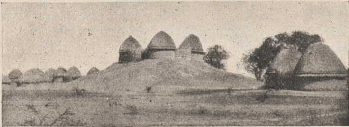
Wioska Szyluków w Chartumie.