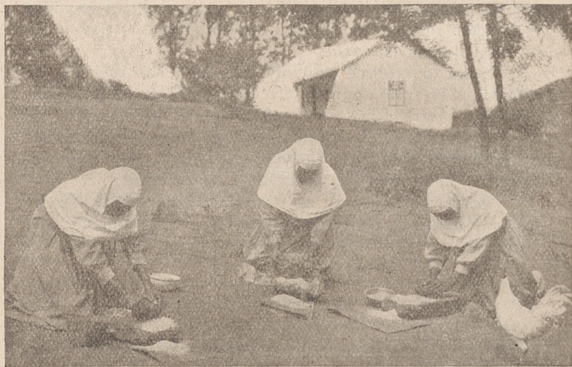
Czarne Siostry miały kukurydzę na kawę (kukurydzę tę najpierw pałą, a potem miały).

Doznałyśmy w połowie lutego bolesnej straty z powodu zgonu naszej dobrej Siostry Aignon, mistrzyni nowicjuszek od 5 lat. Po sześciomiesięcznej obłożnej chorobie uległa zapaleniu nerek, w połączeniu z wrzodami