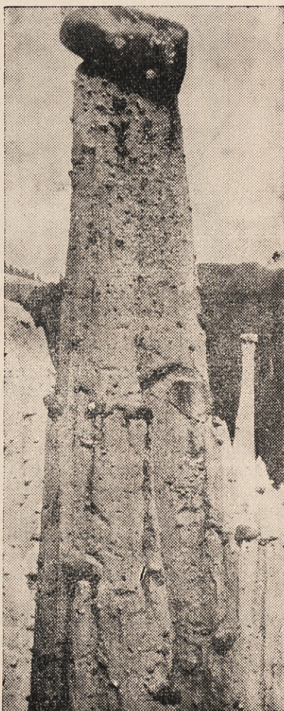
Pas mus tokių uolų nėra