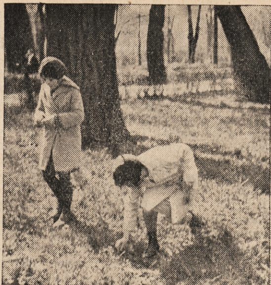
Mes skiname gėles