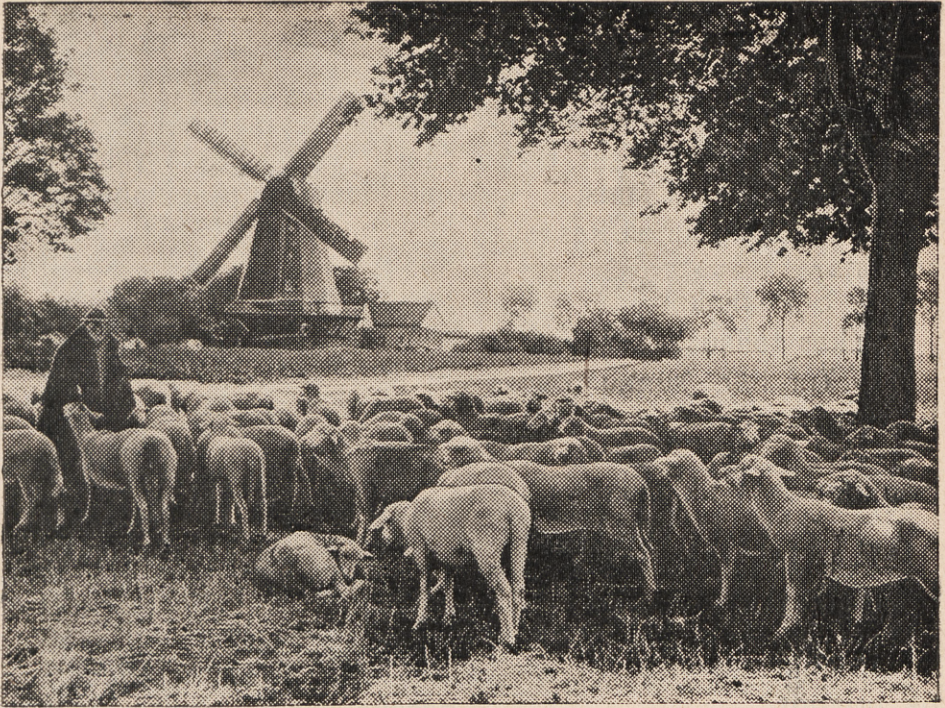
„Škiur-bar namo, pilkosios avelės“.