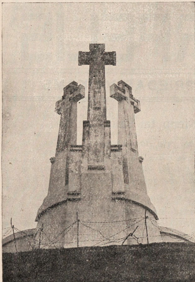
TRYS KRYŽIAI VILNIUJE