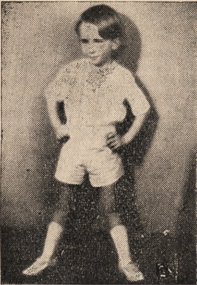
Aš mėginu sportuotis.