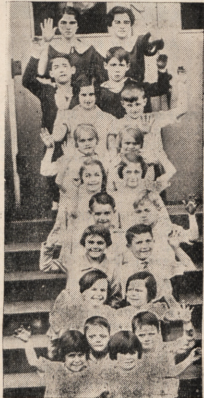
Mūsų šventadienio pramoga

— Ak, — atsiduso iš gilumos širdies maža mergaitė, — kad ir aš nors greičiau užaugčiau! Ir aš eisiu gimnazijon tada... — svajingai pabaigė. S. Seniūnienė.